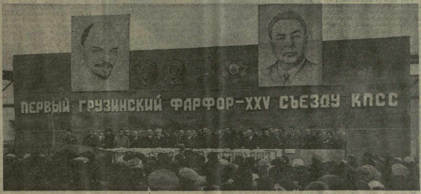
На снимке: торжественный митинг, посвященный сдаче в эксплуатацию Зугдидского фарфорового завода.

Сообщение ТАСС В соответствии с программой дальнейшего развития систем связи с использованием искусственных спутников Земли 27 декабря 1975 года в Советском Союзе осуществлен запуск на высокую эллиптическую орбиту спутника связи «Молния-3» с бортовой ретрансляционной аппаратурой, обеспечивающей работу системы в сантиметровом диапазоне волн. Спутник связи «Молния-3» предназначен для обеспечения эксплуатации системы дальней телефонно-телеграфной радиосвязи в Советском Союзе, передачи программ Центрального телевидения СССР на пункты сети «Орбита» и международного сотрудничества. Спутник выведен на орбиту с апогеем 40.800 километров в северном полушарии и перигеем 470 километров в южном полушарии. Период обращения спутника 12 часов 16 минут, наклонение орбиты 62,8 градуса. На борту спутника, кроме аппаратуры для передачи программ телевидения и осуществления дальней многоканальной радиосвязи, установлена аппаратура командно-измерительного комплекса, а также системы ориентации, коррекции орбиты и энергопитания спутника. Связи связи через спутник «Молния-3» будут проводиться в соответствии с намеченной программой.