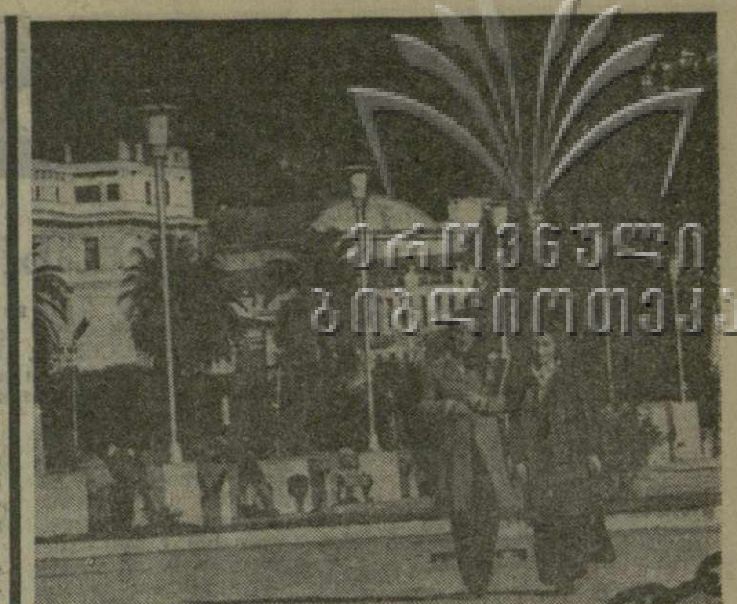
▲ УТОПАЮТ В ЗЕЛЕНИ субтропиков курорты Черноморского побережья Грузии. Благодаря своим природным и климатическим условиям Сухуми, Гагра, Пицунда, Гудаута, Новый Афон привлекают отдыхающих, туристов и в зимнее время года. На снимке: совсем по-летнему солнечно в столице Абхазской АССР — Сухуми.

Вчера музыкальная общественность тепло отметила 50-летие Сулхана Цинцадзе — в Большом зале Тбилисской консерватории состоялся творческий вечер композитора. Г. ТОРАДЗЕ.