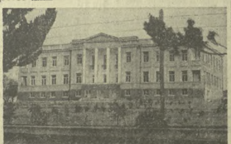
В селе Поцхо Цхакаевского района закончено строительство трехэтажного здания сельской больницы. Новая больница будет полностью укомплектована всеми медицинскими кабинетами.

На сбережения колхозников САЧХЕРЕ. (Корр. «Зари Востока».) Вместе с трудовыми успехами неуклонно растут и доходы колхозников. Сумма вкладов в сберегательные кассы района увеличилась за последний год на 388,461 рубль и в настоящее время составляет 1282,175 рублей. На свои сбережения колхозники приобретают много дорогостоящих вещей, строят жилые дома. В 1966 году 150 колхозников построили собственные дома; в магазинах райпотребсоюза ими куплено 17 дианоим, 72 холодильника, 260 телевизоров, 72 стиральные машины, 212 радиоприемники, много мебели.