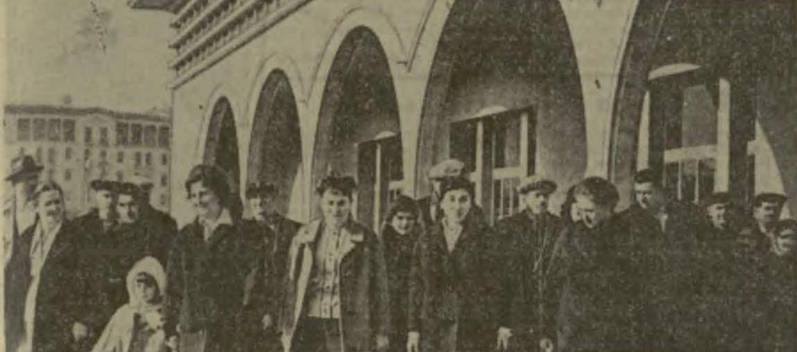
Гости из Маяковского района после осмотра Тбилисского Дворца спорта.