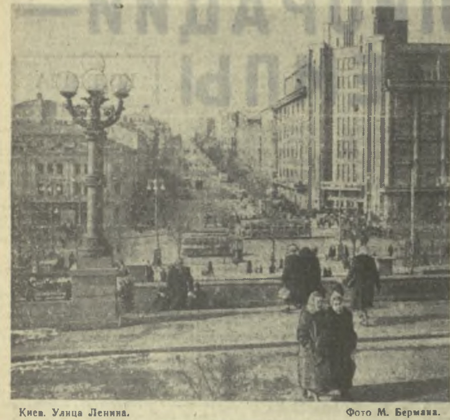
Киев. Улица Ленина.