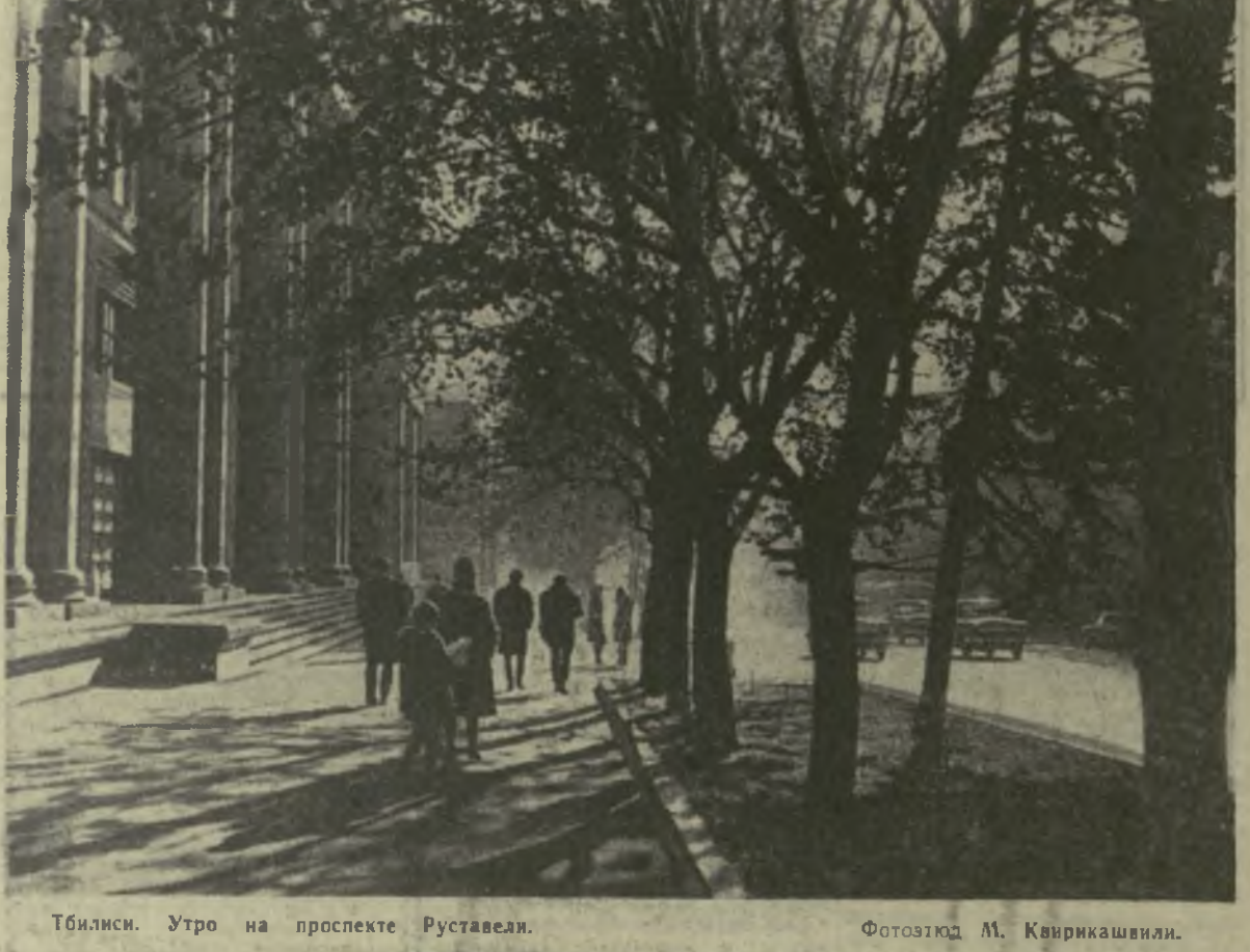
Тбилиси. Утро на проспекте Руставели.

ЖИТЕЛИ квартала 10-Б поселка ТЭВЗа обратились в «Зарю Востока» с просьбой ускорить газификацию их домов. Письмо для принятия мер было передано в исполком Ленинского районного Совета.