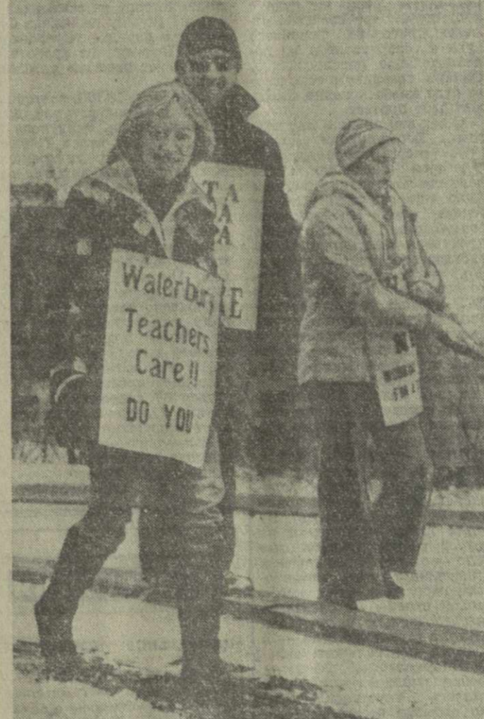
▲ АМЕРИКАНСКИЕ ТРУДЯЩИЕСЯ ведут упорную борьбу за свои жизненные права. Особенно широкий размах борьба приобрела сейчас, когда в результате самого глубокого за последние 40 лет экономического кризиса резко возросла безработица, снизился жизненный уровень миллионов трудящихся из-за постоянного роста дороговизны.

НЬЮ-ЙОРК, 17 марта. (ТАСС). Генеральный секретарь ООН К. Вальдхайм обратился с посланием к международному сообществу в связи с отмечаемым 21 марта по призыву ООН Международным днем борьбы за ликвидацию расовой дискриминации. В этот день 17 лет назад вооруженные до зубов полчища ЮАР расстреляли мирную демонстрацию африканцев — жителей города Шарпвелла.