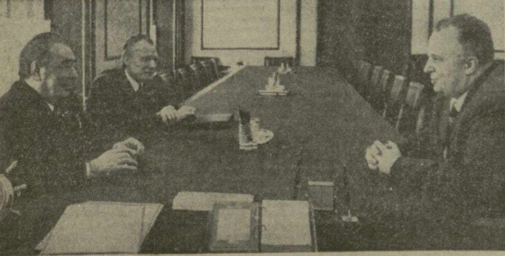
На снимке: во время беседы.

Для участников собрания был дав большой концерт с участием мастеров искусств и коллективов художественной самодеятельности республики. (ГрузИНФОРМ)