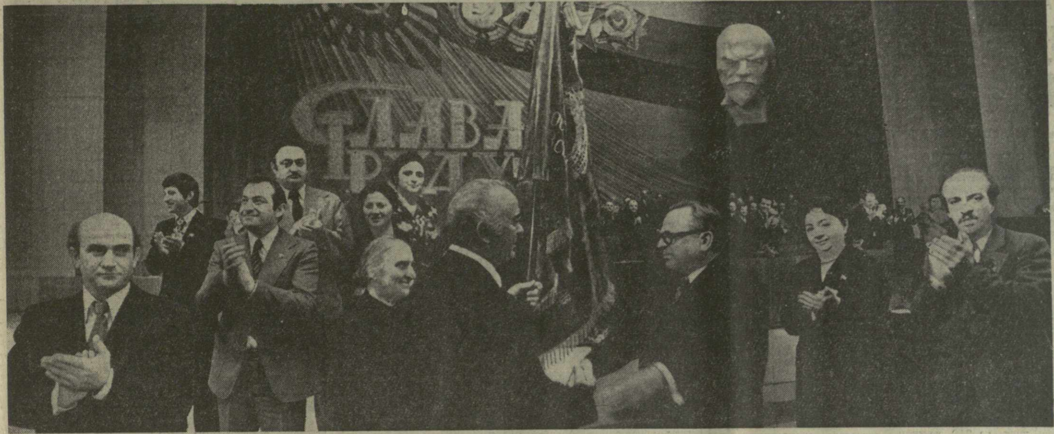
На снимке: вручение Грузинской ССР переходящего Красного знамени ЦК КПСС, Совета Министров СССР, ВЦСПС и ЦК ВЛКСМ.