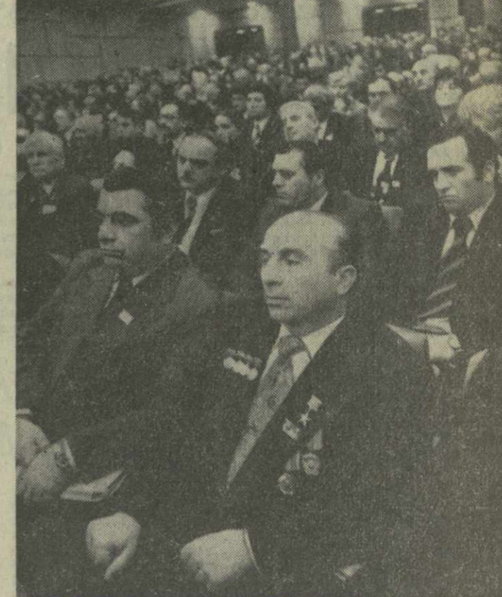
На снимке: делегаты из Грузинской ССР во время заседания.

Звеньевой механизированного звена колхоза имени Кирова Кореновского района Краснодарского края Герой