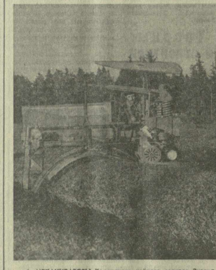
▲ МЕХАНИЗАТОРЫ Хацкерского чайного совхоза Зугдидского района ведут весенние работы: подрезку кустов, культивацию междурядий, вносят минеральные удобрения.