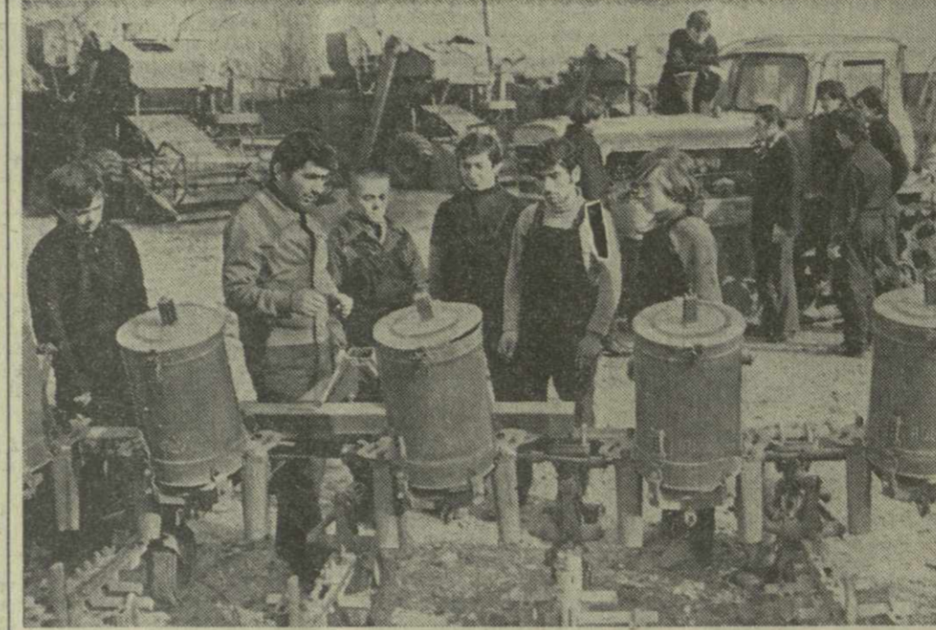
▲ ХИДИСТАВСКОЕ ПРОФТЕХУЧИЛИЩЕ № 15 Горького района во втором году пятилетки выпустило более 400 трактористов, комбайнеров, ремонтников и других специалистов сельского хозяйства. На снимке: идут практические занятия.