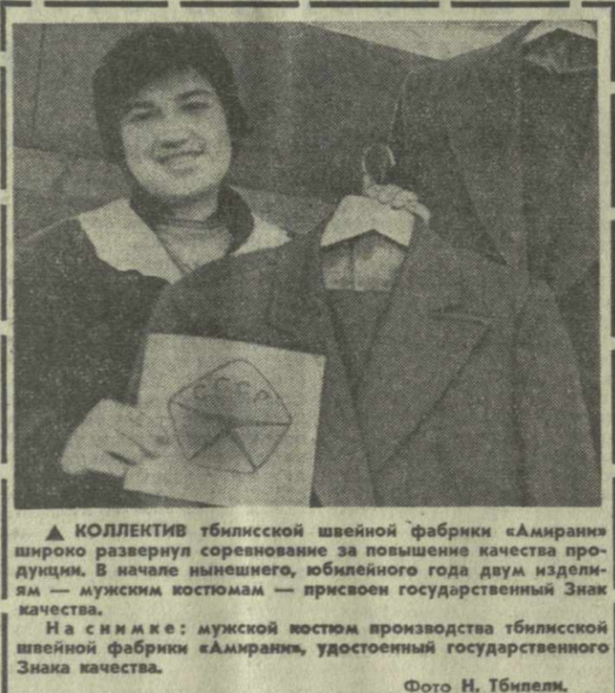
КОЛЛЕКТИВ тбилисской швейной фабрики «Амирани» широко развернул соревнование за повышение качества продукции.

Сейчас на предприятии уже завершён переход к социальным нормам обслуживания. Это дало возможность фабрике высвободить большое количество рабочей силы для других участков.