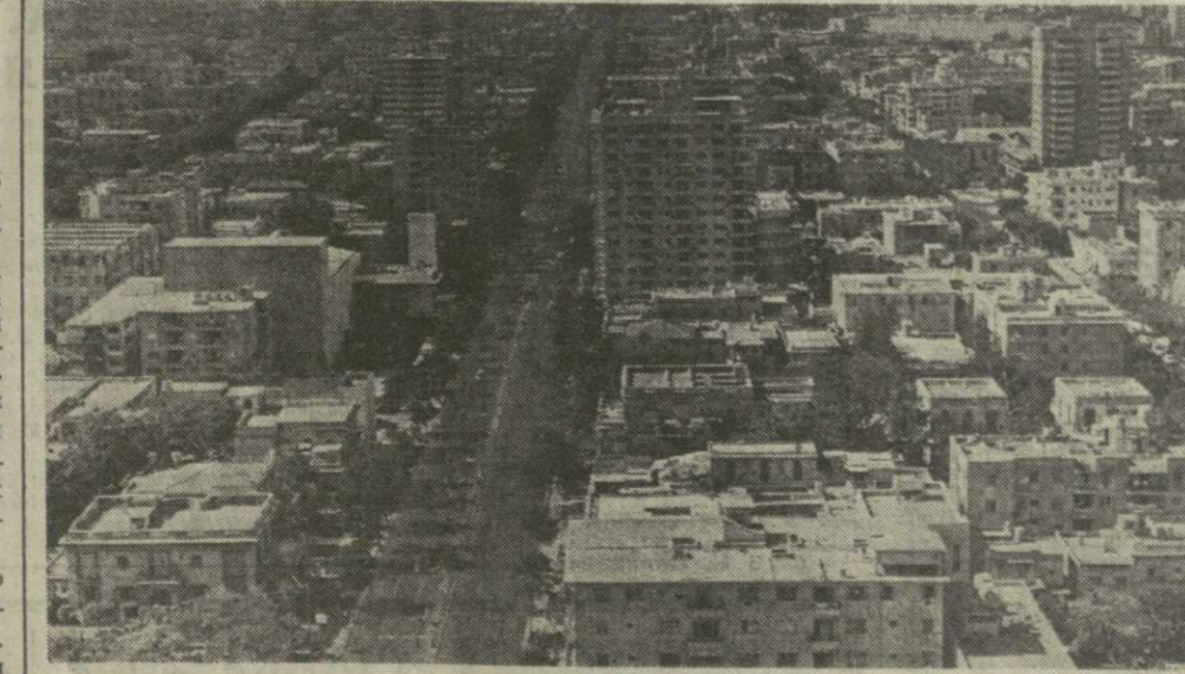
На снимке: панорама Гаваны.

Были дела и похитрее. Завербовав некоторых американских ученых, свидетель-