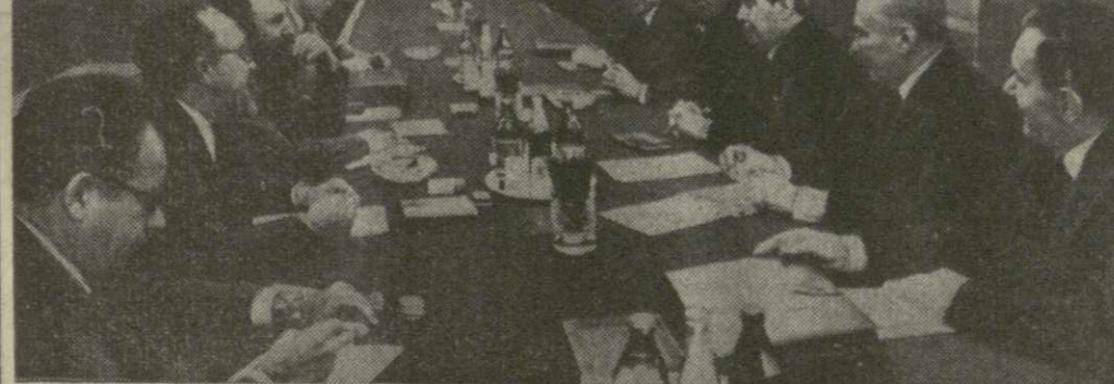
На снимке: во время беседы.

Беседа прошла в атмосфере дружбы, сердечности и полного взаимопонимания.