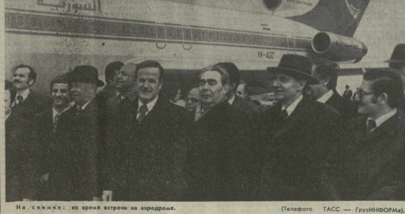
На снимке: во время встречи на аэродроме.

В обстановке дружбы были рассмотрены основные направления развития советско-сирийских отношений. Стороны отметили, что сотрудничество между Советским Союзом и Сирийской Арабской Республикой отвечает интересам народов обоих государств, служит делу укрепления всеобщего мира, торжеству справедливой борьбы арабских народов за ликвидацию последствий израильской агрессии.