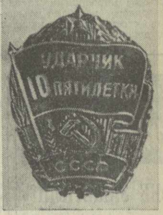
Знак «Ударник десятой пятилетки».