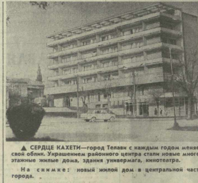
▲ СЕРДЦЕ КАХЕТИ—город Телави с каждым годом меняет свой облик. Украшением районного центра стали новые многоэтажные жилые дома, здания универсама, кинотеатра. На снимке: новый жилой дом в центральной части города.

На заводе идет монтаж автоматического наполнителя соков, созданного одесскими машиностроителями. Это даст возможность увеличить продукцию, пользующуюся заслуженной популярностью. В этом году телавские консервщики ждут серьезный экзамен: их консервы будут представлены в павильоне ВДНХ СССР.