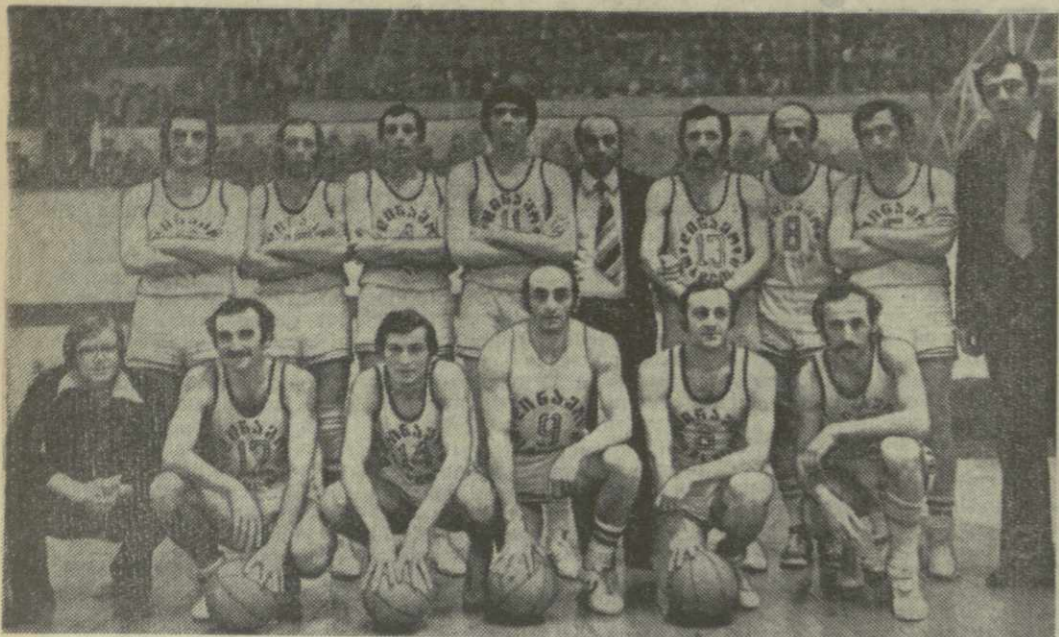
Динамовцы Тбилиси — бронзовые призеры чемпионата СССР по баскетболу.