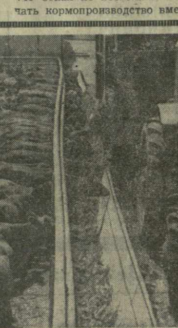
На снимке: механизированная раздача кормов в Гурджанском межхозяйственном животноводческом объединении.

Так, существенную работу ведут юристы по возврату хозяйствам незаконно присвоенной земли. С их помощью в 1975 году колхозам и совхозам возвращено 800 гектаров земли. При активном содействии юрист-консультантов возмещены убытки, связанные с изъятием земель, на сумму 61.600 рублей. По инициативе юридической службы за 1975 год выискано дебиторской задолженности в пользу колхозов и совхозов более чем на шесть с половиной миллионов рублей. Юридическая группа при