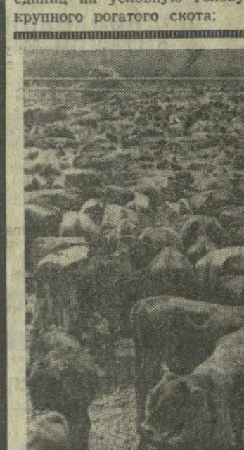
На снимке: механизированная раздача кормов в Гурджанском межхозяйственном животноводческом объединении.

На снимке: механизированная раздача кормов в Гурджанском межхозяйственном животноводческом объединении.