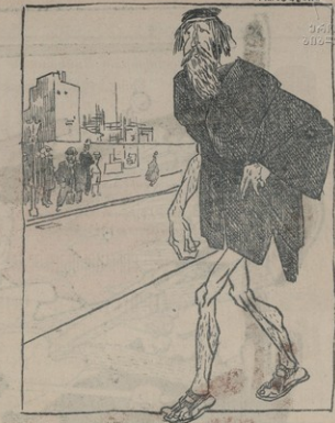
Դէ, հիմա թող այ... դեռսս սպաննէ քննից, երբ ես այսպիսի գրութեան մէջ եմ գտնուում: