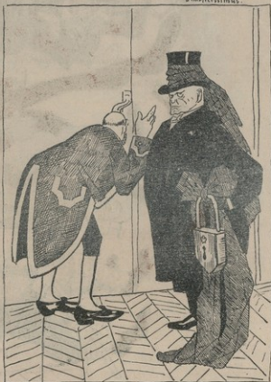
Ռիչուր (Գերմանական կանցլեր)։— Իսկապէս Քիչուրն անեմ, ոչ չազգայնաբար կերպով յայտնեմ Վիլհելմին Ռէյխստագի բարոյմը... քիչ խոսելու համար: