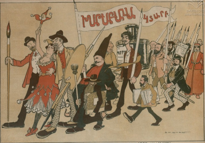
ԳԱՍՊԱՐ ԱՎԱՏՈՒՅԵԱՆԻ ԵՒ ԻՐ ՅԱՆՇԵԱԿԱՆ ԽՈՒՄԻ ԿԱՆԴԵՍԱՌՈՐ ԿԱՆԴԻՊՈՒՄԸ 1909 ԽԻՒ ՆՈՐ ՏԱՐՈՒՆ