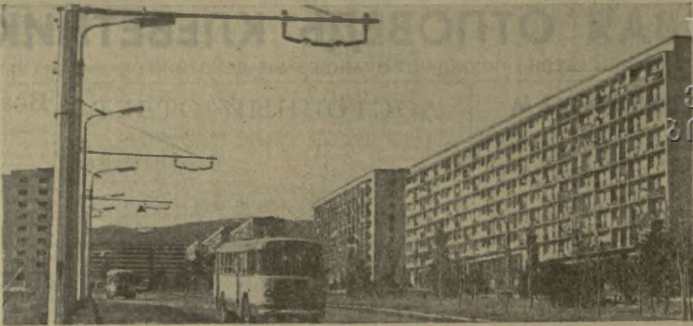
С каждым днем растет и благоустривается Тбилиси. На снимке: проспект Важа Пшавела сегодня.