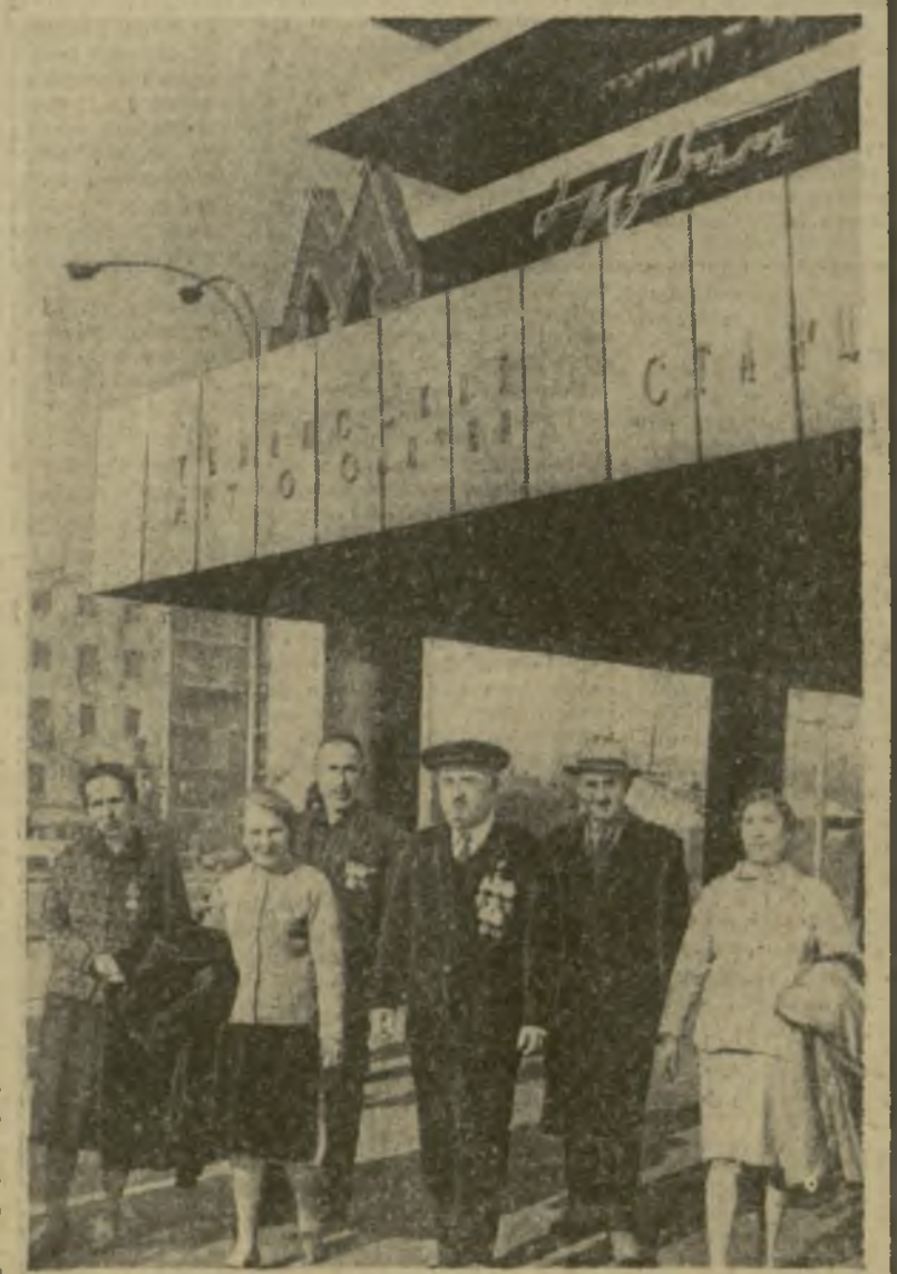
На снимке: гости из Кварельского района у Тбилисского метрополитена.