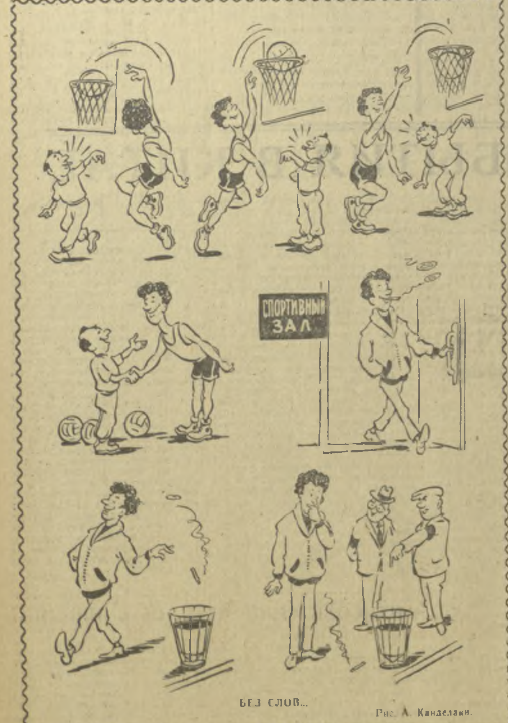
БЕЗ СЛОВ... Рис. А. Канделаки.

В адрес треста «Чай Грузии» из Москвы пришло письмо с просьбой подготовить для отправки на Всемирную выставку в Монреаль партии грузинского чая. Это почетное задание поручено коллективу Тбилисской чайзаводской фабрики. За океан будут отправлены две тысячи пачек «Букета Грузии» и чая «Экстра» в оригинальной упаковке, разработанной в Тбилисском художественно-конструкторском бюро.