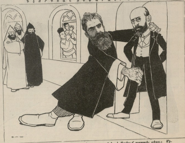
Տեղեկագրին է ստացւած, որ Մեսրոպը նախ սուրբը շանը է թափում ապառիչ տեսուչ Մի- նաս Բերբերանին, որպէսզի ինքը նորից փրտտեսուչ վրնի...