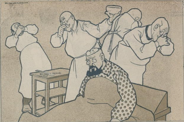
Այլ թէ քննն. այդ յիմարտայաճափ հասած էր. ուղեղի տեղ մէջն՝ ուրիշ բան է եղել...