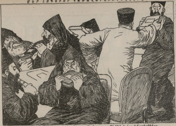
Այ՛ թէ Բնչդէս են անյայտնում ազգային հաստատութիւնների հաշեմատեանները.