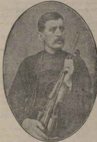
Ա Շ Ո Ւ Ղ Ը Ի Ի Ա Լ Ի Ն

— Դա կուս կուս. ի շուզիք բաշարտ նե-տու կուս, մոյ խիթ պոլիցա նաշոյ կուս: — Աս, նի պաշուս ստի, շուս տի սարապ մարտալ զամարիչ տի, կու պոլիցան ստի: — Նի սոլո կուս: Ավալանիկը մեղկուս տալց թէ՛ էտ շա-լակի կու զուայիմ, զմորնիկ էլ էկուս տ-ից թէ՛ մն նաշ խազէլին, կուս, նամս վունցիչ շուկից: — Չաշնմ բաշարտ նեխ կուս: Ջէր էլի Նոցի էկնր կանգնած, վուր մէ էրկու խաթաբալայիանիք էկան, ուղում ին բեղակիլին մանի: Մալգաթը ձէն ուղից՝ ասոյ սարկու կուս կուս: Տէրբը կարկնցին: Իմում միք ստիգրիցը մէ էրկուն էլի էկան: Սրանց էլ կարկնցին: — Բաշարտ Եսա, կուս, նորցրից ստի-ցոր: