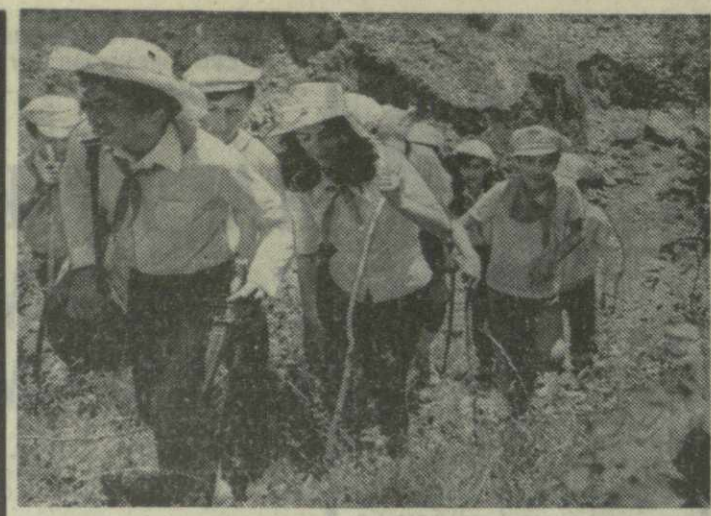
▲ С ПРИХОДОМ ЛЕТА стало оживленно в селе Квемо-Ходашени Телавского района — очередной сезон открылся в пионерском лагере «Юнора муха».

Сейчас объединение, созданное в начале этого года из 108 мелких, разрозненных мастерских и ателье, располагает 30 укрупненными головными ателье. Недавно тбилисцы получили еще ряд специализированных предприятий по пошиву одежды. После реконструкции на улице Пекинской открылось ателье «Мать и дитя». Ателье на улице Барнова специализируется на пошиве женской одежды. Специализированные ателье по пошиву мужских сорочек, мужских и женских головных уборов, меховых изделий, мужских и женских брюк, предметов женского туалета, мужской и женской верхней одежды, чехлов для легковых автомобилей открылись на улицах Октябрьской, Павлова, Серебряной, Лермонтова, Шардена, Леселидзе, Толстого. Для приближения услуг к рабочим и служащим крупных предприятий и учреждений объединение устраивает показ новых тканей и принимает заказы на пошив из них одежды.