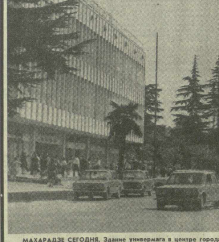
МАХАРАДЗЕ СЕГОДНЯ. Здание универмага в центре города.

18 новых фасонов женской одежды, разработанных Домом моделей и проектно-технологическим институтом Министерства бытового обслуживания населения Грузии, предлагают к летнему сезону специализированные ателье индивидуального пошива женской одежды объединения «Тбилисдодежда».