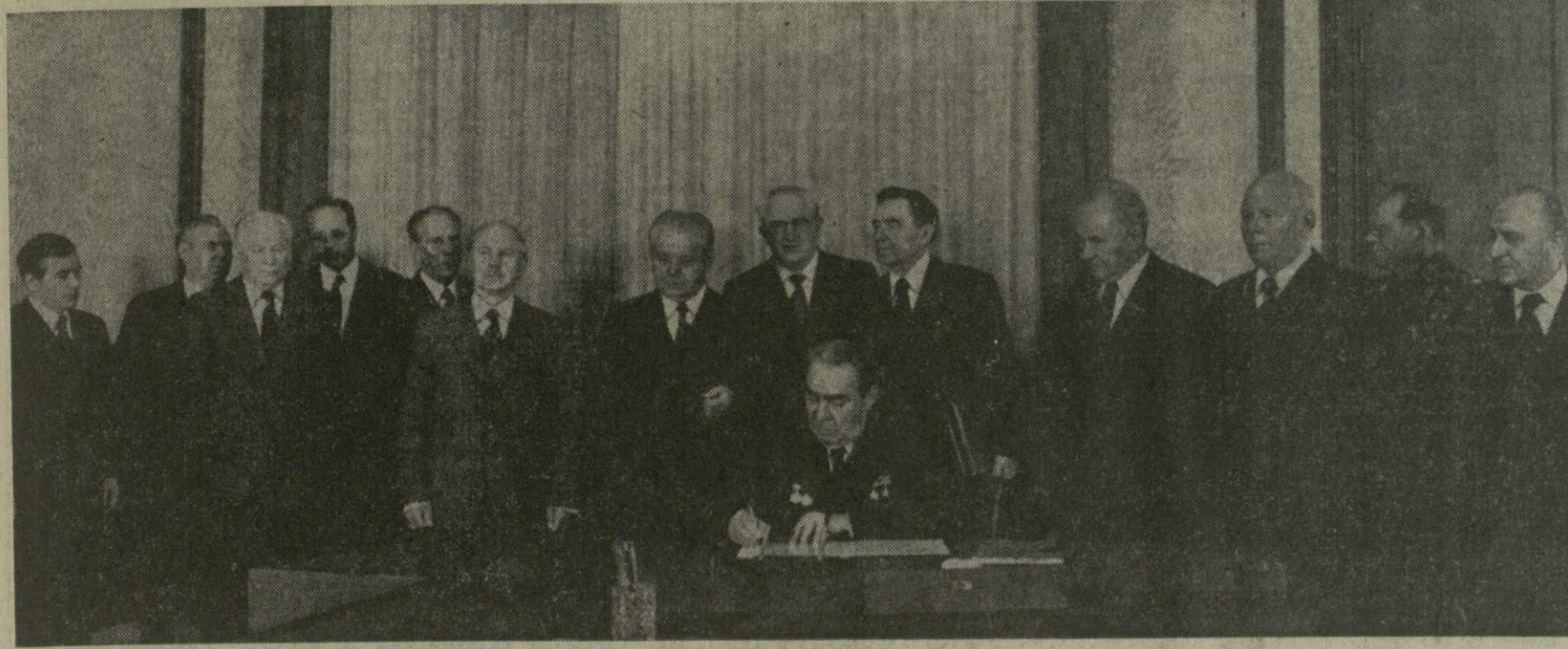
На снимке: во время подписания воззвания.