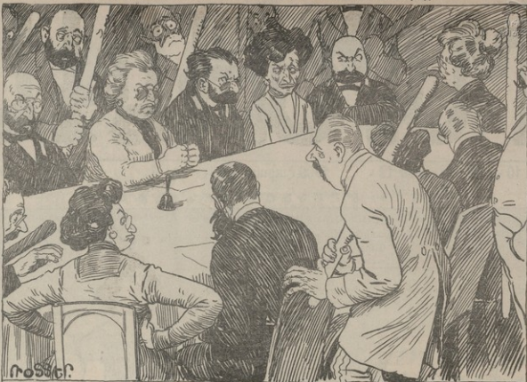
Դպրոցների հոգաբարձուքի՛նք ասիւցւած է մանկավարժական ժողովին զազանակներով կարգը պահպանելու: