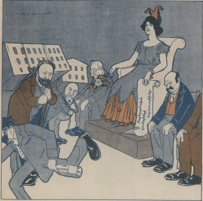
«Մշակի» խմբագրությունը.—Մենք մեր կայքով եկել ենք պատասխան ապուր հասարակութեան առաջ հաւարած գումարների համար, իսկ դուք, «Ժողով» և «Նախադրանք» դեկամբրները դուք մեր կը փախչու՛մ (Տես Մշակ)» «Գործի» ղեկավարներ.—Գողեր, աւազակներ, դուք կեդաի ծնունդներ և ալլ (Տես «Գործ»)