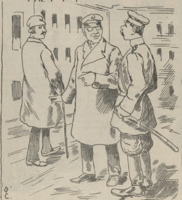
—Է՛յ ոստիկան, լսում ես, վերջրու այս մարզուն և ասք ոստիկանատուն, նա կարծես թէ կառկածել է: —Ես նրանում ոչինչ կառկածելի չեմ գտնում: