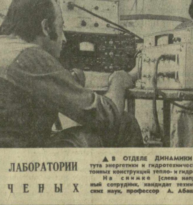
В ЛАБОРАТОРИИ УЧЕНЫХ