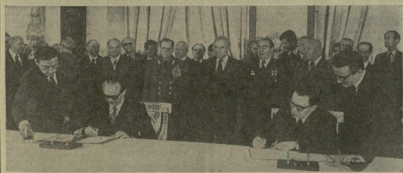
На снимке: во время подписания соглашения.