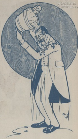
Գ. ՀՐԱՆԴԸ (Նեղիակ անհարմար Քերթեանի օրով բաշխիքի)

Գ Ա Ր Ն Ա Ն Յ Ո Յ Ձ Ե Ր Օրհորդ.—Ձե, չե... ձեք բաշէ ի սը Ասանջ: Ես չեմ նստում մարդանոց, պատմարդի խիստ շուտ եմ մտածում ի- րանց խտասուկերը: Գարունը.—Բայց, բայց սիրելիս... զու անխից ես զգաի մեջ, մզ է քեզ խտսու- րում մեր խտասուկերը միշտ չիտկանջ մեջ: