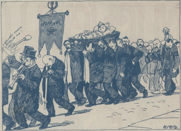
Քերթում (Քարդասպան երկիր) ծնեց (հիմեաց) և երեք օրից յետոյ մեռաւ (փակեաց) Հասարակական Ժողովարանը, իորը վիշտ պատճառով սեղի Հասարակութեան.

Աստած նպին յուսարտ, Պաշտօններն կեանք ներէ: