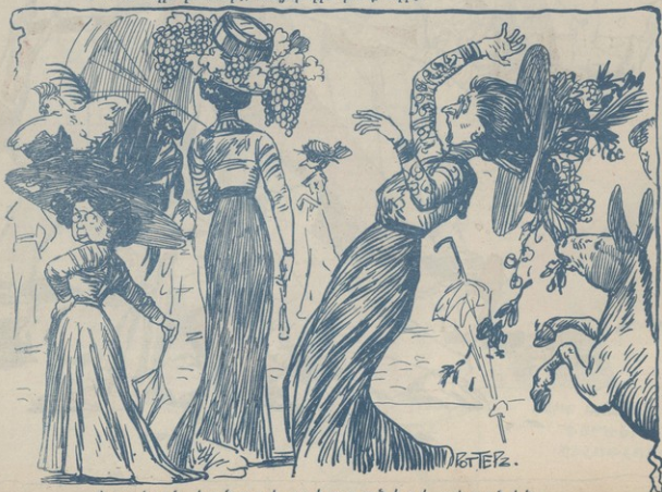
Փարսան կանացի շէն պաների սեղանին