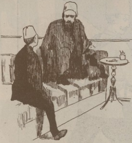
Կ Ա Ն Ա Ղ Ա Ն Ն Ե Ր

— Հարցի, Արդիւ՞համբը կարեալանքը էր սարքումս։ — Այո, սարքում էր և կարումս։ — Մուճակդ սուլիանն էլ կարում է. է՛ն, այստեղ էլ է՛նը զանազանութիւնս։ — Այո զոս յիտարիկս, մե՛ն զանազանութիւն կայ. Համբը կարում էր, որ արդիւք լինի սանճանարքութեան, իսկ Մուճակը կարում է ՚ի պատիւ սանճանարքութեանս։