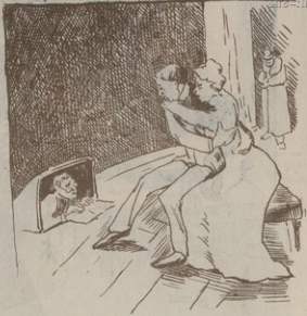
Ք Ա Տ Ր Ո Ն Ո Ւ Մ

— Հարցի, Արդիւ՞համբը կարեալանքը էր սարքումս։ — Այո, սարքում էր և կարումս։ — Մուճակդ սուլիանն էլ կարում է. է՛ն, այստեղ էլ է՛նը զանազանութիւնս։ — Այո զոս յիտարիկս, մե՛ն զանազանութիւն կայ. Համբը կարում էր, որ արդիւք լինի սանճանարքութեան, իսկ Մուճակը կարում է ՚ի պատիւ սանճանարքութեանս։