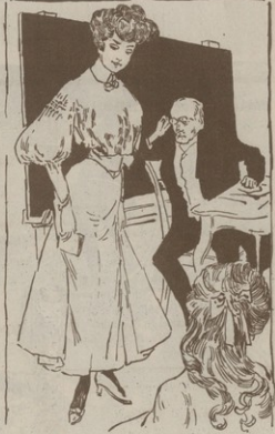
Ք Ն Ն Ո Ւ Ք Ո Ւ Ե

— Այ՛սր Սեւիցո՛ն են խոզու՛մ. զանք Բատրանի։ — Ի՛նչպէ՛ն կարի՛ն է. ի՛նչ կաննն մարդիկ. ես յիտարիւք եմ զրել. իսկ զոս էլ չեմ մարդի. շեւաղս և նայց Բատրանի. զոս իսկի չի սուղում. Գի՛... Հայոց Բատրանի։