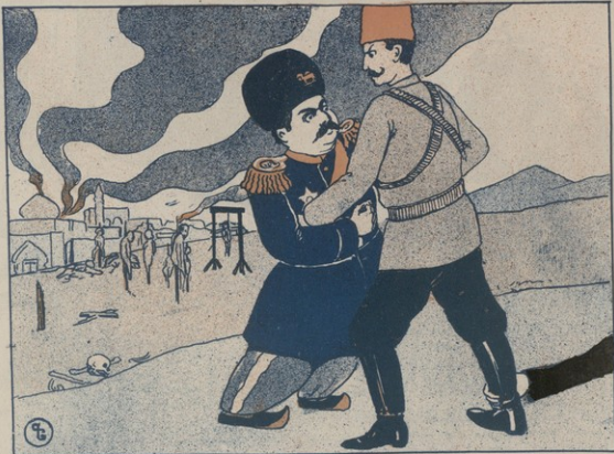
Յոթնամյա և Մանգուկին և Վր յարիկ