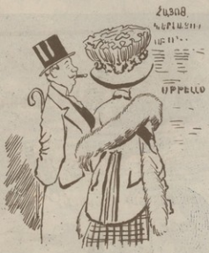
ՀԱՅՈՑ ԿԵՐԱՅՈՒՄ ՍՐԵՍՍ ՍՐԵՍՍ

Յարուար. (Խաղիւք տալով սիրոյն).— Եւ ես զկար է կրտսոյրիայիսի Ենթարկի՛ն զս արտիկս։ Սիրոյր. (Յաշարտիկ).— Ի՛նչք Աստուջ, ոչ մի խաղ կրտսոյրիայիսի մասին Քարտումս սասիկանքի կան, կարոց երբ Գանակելի։