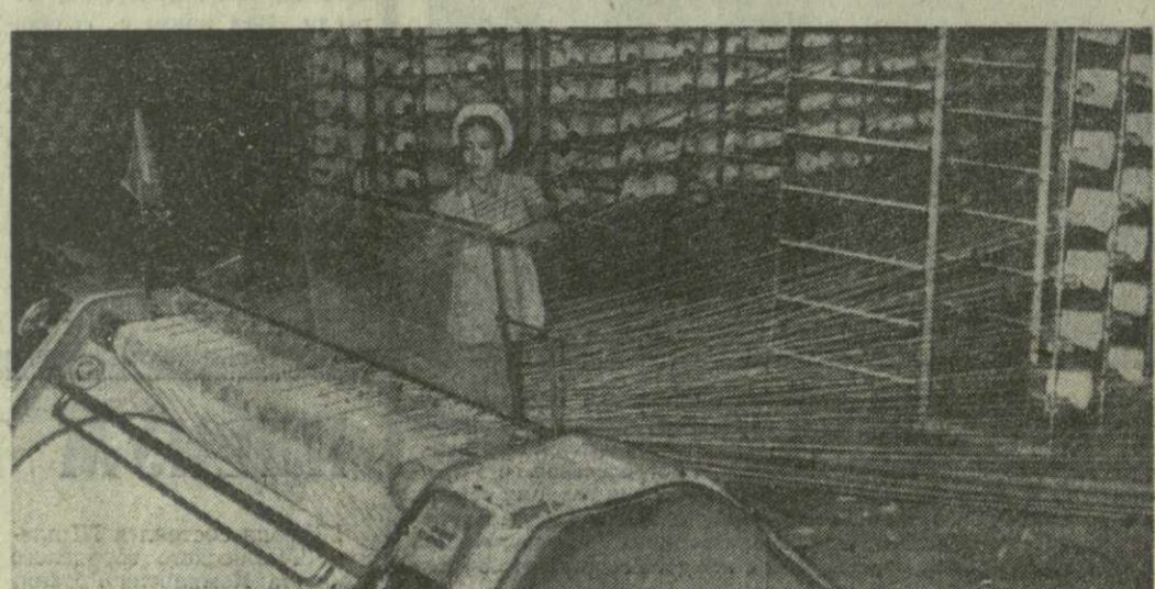
▲ ПРОМЫШЛЕННОСТЬ юга Социалистической Республики Вьетнам постепенно избавляется от зависимости в импортном сырье и материалах. Администрация на местах оказывает содействие мелким и средним предприятиям в увеличении производства и числа рабочих мест. В городе Хошимине еще 52 тысячи рабочих заняты места у станков.

РИМ, 28 июля. Корр. ТАСС Л. Полунина передает: Христианский демократ Дж. Андреотти, которому президент Италии поручил сформировать новый кабинет, получил вчера от своей партии мандат на создание однопартийного правительства. В ближайшие дни он представит президенту, а затем парламенту список министров. Новый кабинет будет состоять лишь из представителей христианско-демократической партии и не будет располагать в парламенте заране обеспеченной поддержки большинства. Его существование будет возможным только при условии нейтрального отношения со стороны Коммунистической, социалистической, социал-демократической и республиканской партий. Именно это были вынужденные констатировать христианские демократы на состоявшемся вчера заседании руководства партии. Они обратились к другим партиям с предложением воздержаться при принятии голосования в парламенте в пользу доверия новому правительству. Республиканская и социал-демократическая партии в ходе прошедших консультаций в связи с правительственным кризисом уже выразили готовность занять нейтральную позицию по отношению к однопартийному кабинету. Социалистическая и Коммунистическая партии определяют позицию на заседании своих руководящих органов, которое состоится в эти дни.