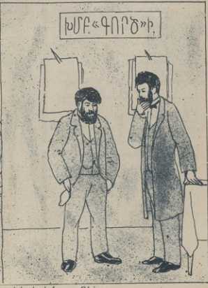
Նորանգապներ արգելել է խմբագրութիւններին փող նստարել աղետարներին համար.