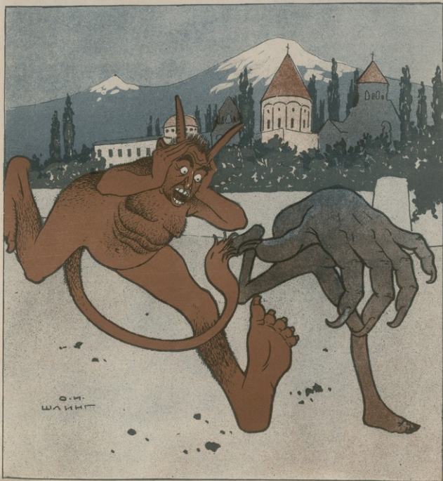
ԿՈՆՄԱՐՆ ՈՒ ԲԱՔԸ ՓԱՆՁՈՒՄ ԵՆ, ԵՐԷ ՏԵՆՆՈՒՄ ԵՆ ՏԵՐՈՋ ԿԱԸ.