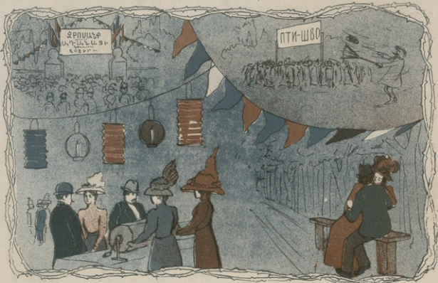
ՋԲՕՍԵՆԻՔ ԳՕԴՈՒՄԸ ԵՂԵՆՆԵՏԻՆԵՐԻ