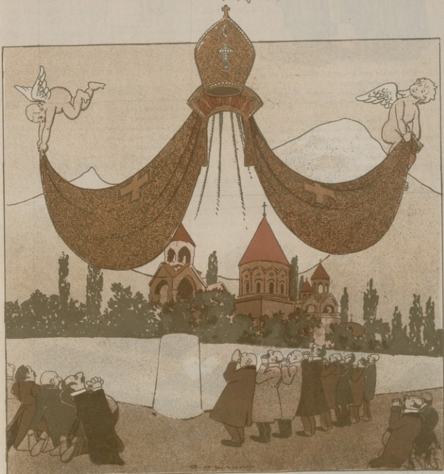
ՄԵՐ ԱՐՄԱՏԱԿԱՆ ԻՆՏԷԼԻԳՆԵՐԻԱՆ ՆԵՐԿԱՑ ՕՐԵՐՈՒՄ.