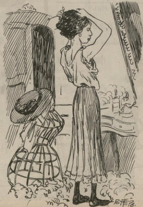
Տանը տուալետի ստաջ,