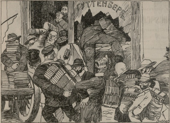
Տեղի վերհացողը գտազբեր է կողմում և հայ մանկանց ու զբոսիչն մտուցանում: