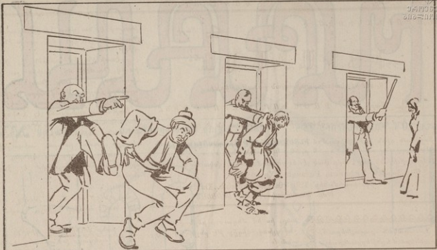
ԿՆՐԻՔԸ ՍՏԻՊՈՒՄ Է