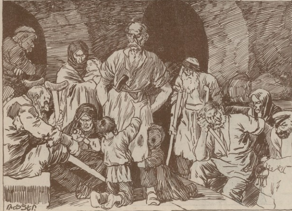
—Ո՛հ զգրագոյ օրեր, ուր է թէ մեռնենք. զէթ սև հագի տակ քիչ հանգիստ տանենք: