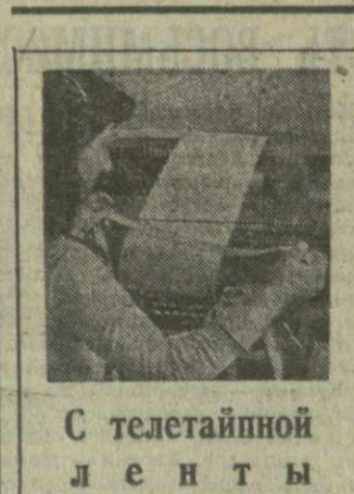
С телетайпной ленты

Нью-Йорк, 25 августа. (ТАСС). Поездкой был непрофильный и неравным, а исход его был решен ударом судейского молотка. Бердик — в крупнейшем городе США остались без работы еще 3,5 тысячи учителей, а школьным предост теперь начать новый учебный год в еще более переполненных классах и заниматься по еще более урезанным программам. Верховный суд штата Нью-Йорк признал «недействительным» закон, принятый законодательным собранием этого штата, который предусматривал увеличение расходов на образование на 150 млн. долларов. Любят-