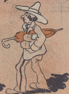
Հ Ա Յ