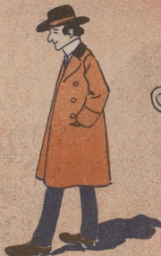
Վ Բ Ա Յ Ի