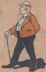
Ի ՈՒ Ս