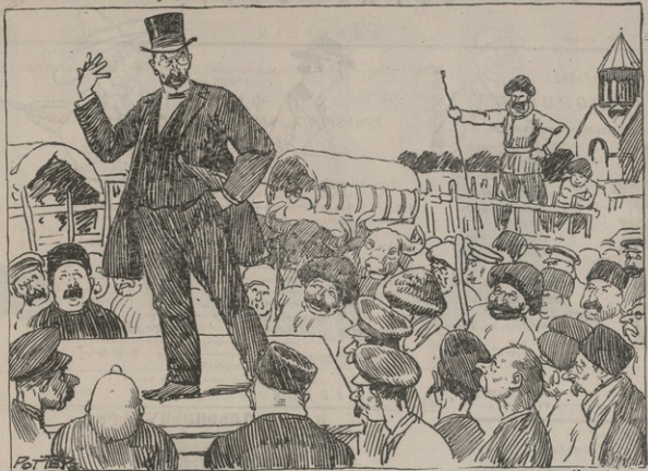
Հարկաւոր են մի քանի ուսուցիչներ և դաստիարակներ, ցանկացողները թող շտապեն: (Ան շտապում են, ով գործ չունի):