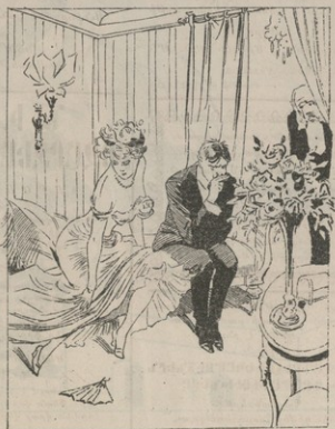
Տիկին եանկեթ ինչքեմ, սեղանը պատրաստ է՝ զուգուց: