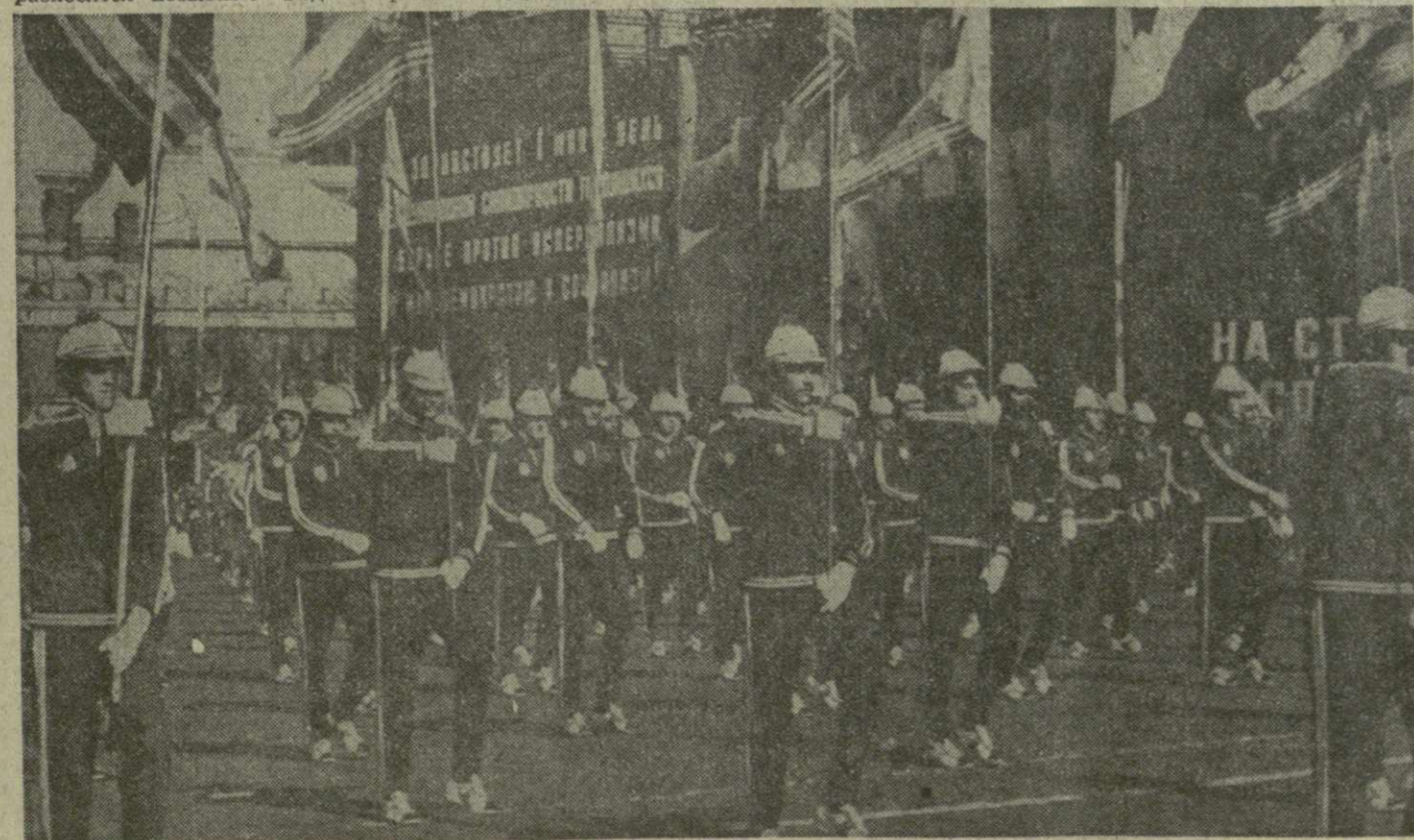
МОСКВА. Празднование 1 Мая 1977 года. На снимке: парад физкультурников на Красной площади.

Успеху способствовало сотрудничество ЭБРЗ с Грузинским политехническим институтом имени В. И. Ленина и Институтом экономики и права Академии наук республики.