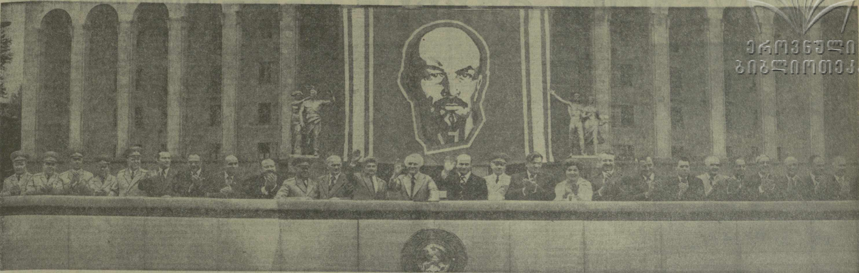
ТБИЛИСИ. 1 мая 1977 года. На снимке: на центральной трибуне.