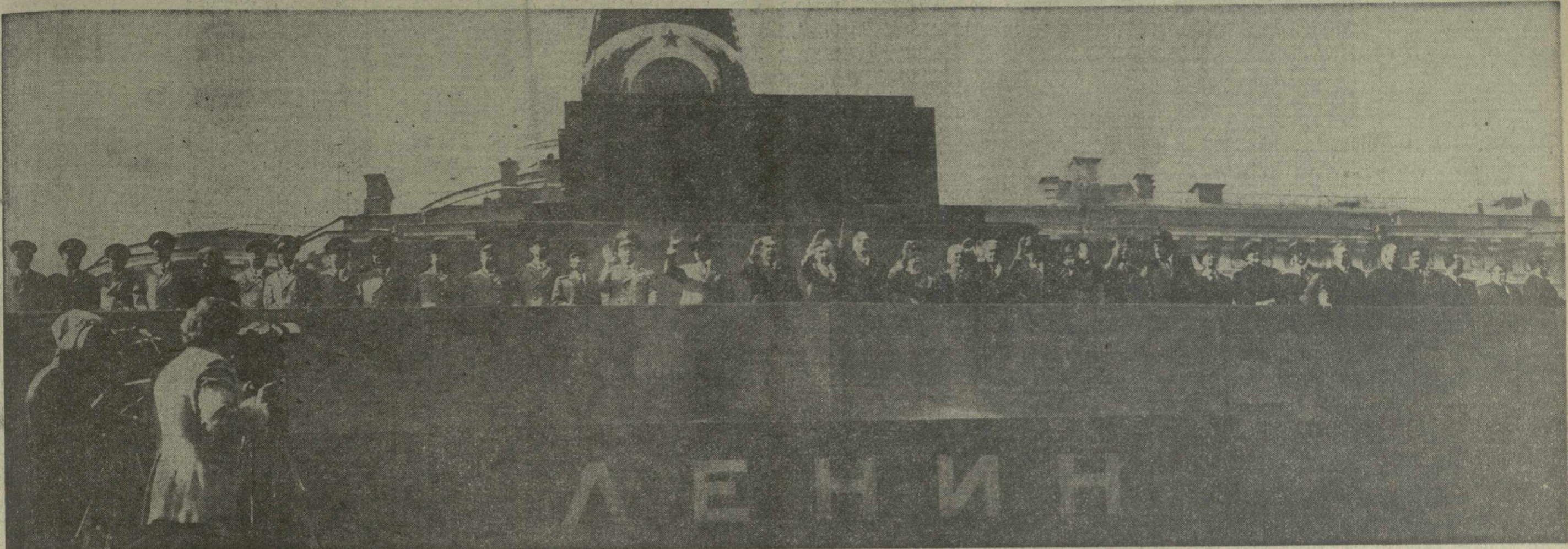
МОСКВА. Празднование 1 Мая 1977 года. Демонстрация трудящихся на Красной площади. На снимке: на трибуне Мавзолея В. И. Ленина.

Нынешний праздник — шестидесятый Первомай — продемонстрировал единую дружбу советских людей с честью выполнить планы, намеченные XXV съездом КПСС, повысить эффективность и качество работы во всех сферах созидательной деятельности.