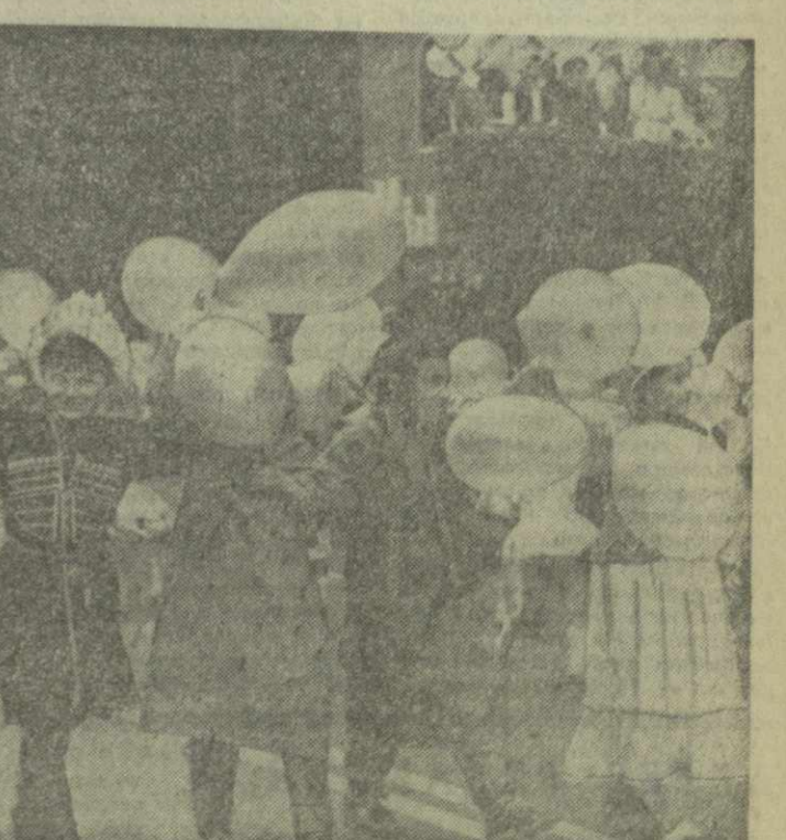
ТБИЛИСИ. 1 мая 1977 года. На снимках: в колоннах демонстрантов на проспекте имени Руставели.