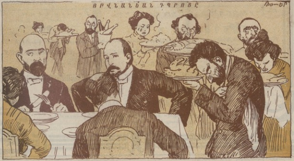
Հնուցուց ՚իմ ՚ոգարարմովեան, ստուշական խումըը պատուցը ըմբիթով