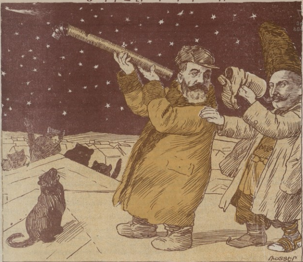
Գառար Կալասուզեանը և Մահ. Չմէկեանը դիտում են տիեզերք և Հայկէ մ'ըրաւար