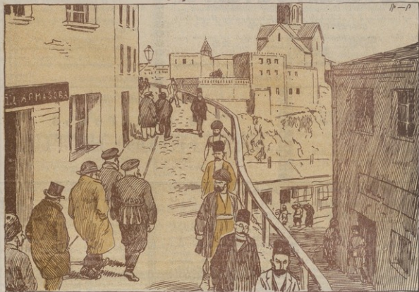
ԿՐԱՆՔ ԳՈՒՄ ԵՆ, ՄԵՆՔ ԳԵՈՒՄ ԵՆՔ. ՈՒՐ... (Առաջին գնողը ստանում է շեռաթուղթը մի տարալի կոստյումից)