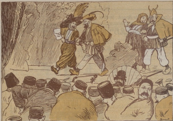
«Բազում թուրքերը օպրանքն են նե, փայտնում թուրքերն լիզով, յասարակութիսնը մ'իշա ծույր լիծալը ցնում է թատրոնը» (Հրազդանից)