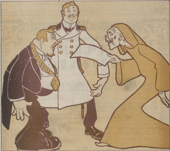
—Ներդա՛րին կանչե՛ր, զբա՛սուր փողոցները միշտ մաքուր ենք պահում, բա՛սկան գու՛մարներ ենք մախում —Բայց ես խաղճիխոնկն լիստ ունիմ, ազգասների տէրը ե պաշտպանը ես եմ...