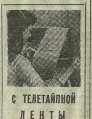
С ТЕЛЕТАЙПНОЙ ЛЕНТЫ

уважения суверенитета и территориальной целостности обеих стран». «В духе братской дружбы Кампучия и Вьетнам смогут решить пограничную проблему и установить прочные дружеские отношения, что отвечает интересам чаяниям лаосского народа, а также миролюбивых народов Юго-Восточной Азии и всего мира», — сказал Пхун Сипасет. Как известно, правительство СРВ неоднократно высказывало готовность без промедления начать переговоры с Кампучией в любом месте и на любом уровне. Однако Пномпень отклоняет эту инициативу.