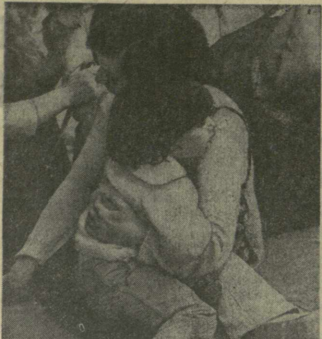
На снимке: у могилы Неизвестного солдата в тбилисском парке Победы.

Эти слова, начертанные на могиле Неизвестного солдата в тбилисском парке Победы, никого не оставляют равнодушным.