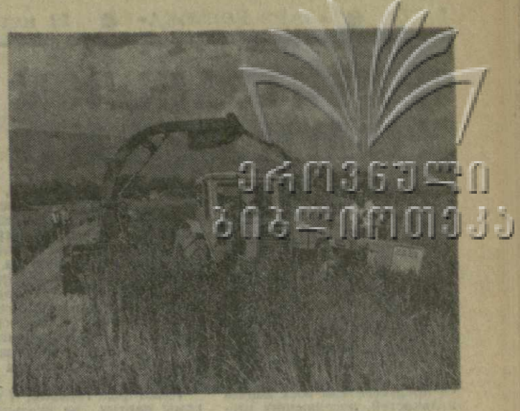
На снимке: уборка вико-овсяной смеси в колхозе имени Цхакая села Хуци, Гечечкорского района.

СЕГОДНЯ НАЧИНАЕТСЯ МЕСЯЧНИК ПО ЗАГОТОВКЕ КОРМОВ