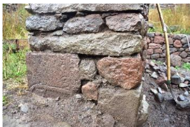
ქვა მიწის ფენის მოშორებამდე

„...|-----|მბ(ა)ვრი, აბ(ა)სერ(ი)ს თ(ა)ნ[ა], [დაი]/ც(ე)ვ (?), ჯ[უარო](?)“.