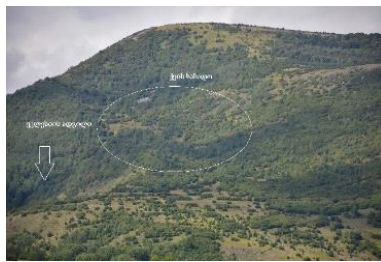
ქვის საბადო და ეკლესიის მდებარეობა