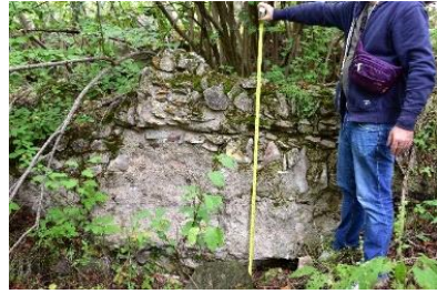
ეკლესიის შემორჩენილი ფრაგმენტები