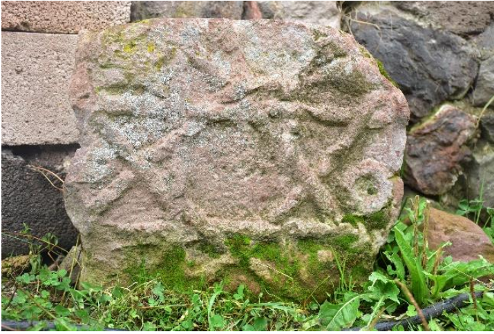
(ტაო-კლარჯეთის ძეგლების 2019 წლის საკვლევე ექსპედიციების ანგარიშები. (2021): 107).

ამრიგად, ბასილი ზარზმელის აგიოგრაფიული თხზულების „ცხოვრებაჲ ... სერაპიონისი“-ს (IX-X ს.) და აბუსერიძე ტბელის რელიგიურ-ისტორიული თხზულების „სასწაულნი წმიდისა გიორგისნი“-ს (1233 წ.) ტექსტის ეპიზოდების შეჯერებით ტოპონიმიკასა და ახლადმიკვლულ არქიტექტურულ-არქეოლოგიურ არტეფაქტებთან, შეიძლება ვივარაუდოთ, რომ ღრმანისწყლის ხეობაში მდებარე თანამედროვე თურქეთის არდაჰანის (არტანის) პროვინციის ფოსოფის (ფოცხოვის) რაიონის სოფელ გონულაჩანის (Gönülaçan/Posof /Ardahan) მიდამოებში მდებარეობდა შუარტყლის იოანე ნათლისმცემლისა და წმინდა გიორგის ეკლესიები.