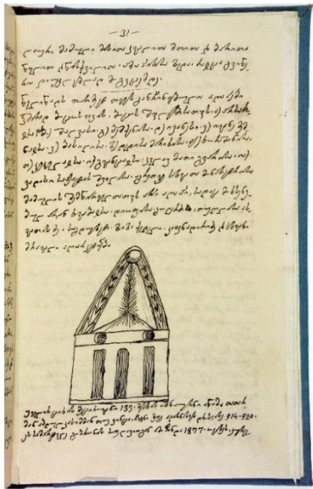
(გვარამაძე, ივ. [ვინმე მეხსი]. (1909) კ. კეკელიძის სახელობის ხელნაწერთა ეროვნული ცენტრი, ივ., გვარამაძის ხელნაწერი არქივი: H 2786: 31).

მშენებლობისა კურცხანისა და ოცხის წყლის შესართავთან აღმოჩენილა წმ. მიქაელ-გობრონის ქვის საფლავი. ... „ნაწილნი წმიდის ქვის კუბოთგან ამოიღეს და ძველი ეკლესიის გალავანში დამარხეს. ... საფლავის ქვა წარწერილი და ნათლოვანი სარქველით თბილისის მუზეუმის კარ წინ ჰყრიან ...“