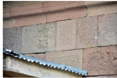
ასომთავრულწარწერიანი ქვის ორი ფრაგმენტი

(ტაო-კლარჯეთის ძეგლების 2019 წლის საკვლევო ექსპედიციების ანგარიშები. (2021):106, 107).