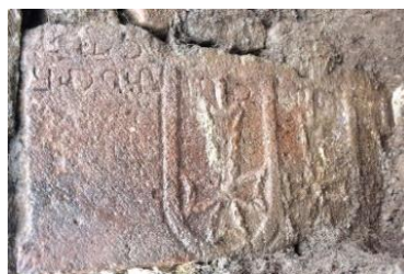
ქვა განმედიის შემდეგ

(ტაო-კლარჯეთის ძეგლების 2019 წლის საკვლევო ექსპედიციების ანგარიშები. (2021): 101- 103).