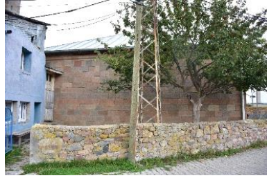
ჯამეს დასავლეთ ფასადი წარწერიანი ქვებით