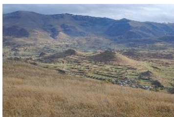
ხედი ყველის მონასტრიდან ყველის ციხეზე.

(ტაო-კლარჯეთის ძეგლების 2012-2013 წლების საკვლევო ექსპედიციების ანგარიშები. (2019): 26); (ხუციშვილი, თ., ნიქარიშვილი, ლ. და კოლუაშვილი შ. (2012-2013): 512, 513).