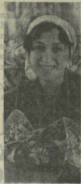
предприятия за прошедшее время укрепились. Скоро батумские швейники намерены побывать в гостях у горьких, чтобы ближе познакомиться с их работой.

Отношения между двумя предприятиями за прошедшее время укрепились. Скоро батумские швейники намерены побывать в гостях у горьких, чтобы ближе познакомиться с их работой.