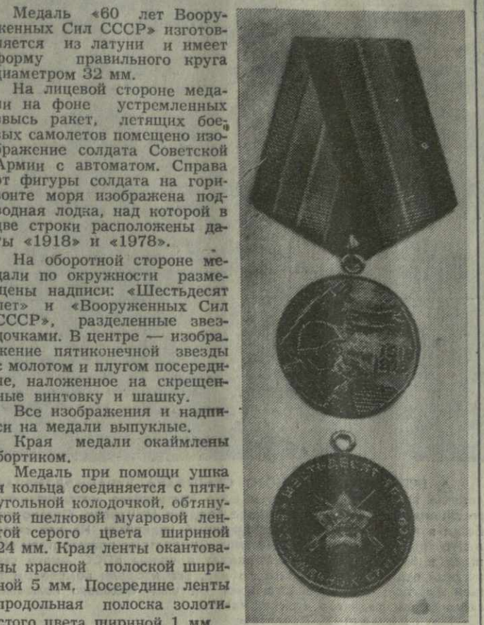
На снимке: юбилейная медаль «60 лет Вооруженных Сил СССР».

Секретарь Президиума Верховного Совета СССР М. ГЕОРГАДЗЕ.