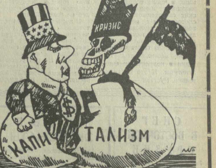
БЛИЗНЕЦЫ. Рис. из газеты «Гранма».

Экономика США и других ведущих стран капиталистического мира по-прежнему находится в состоянии глубокого кризиса, и надежды на улучшение положения в 1978 году вновь не преувеличивает. Неудачи капиталистической экономики неизменно, поскольку она обусловлена самой природой отживающего свой век строя эксплуатации и наживы. (Из газет).