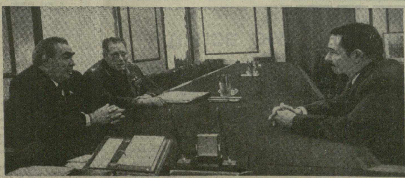
На снимке: во время беседы.

ных сил Республики Куба Р. Кастро. В беседе принял участие член Политбюро ЦК КПСС, министр обороны СССР Д. Ф. Устинов. В ходе беседы состоялся обмен мнениями о дальнейшем укреплении и развитии братских советско-кубинских отношений. Были затронуты также некоторые вопросы международной жизни, представляющие интерес для обеих стран в современных условиях. Беседа прошла в атмосфере дружбы, сердечности и полного взаимопонимания.