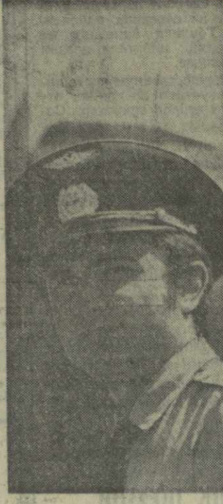
На снимке: С. Эмба, Фото И. Чохонелдзе. (Фотохроника Грузинформ)