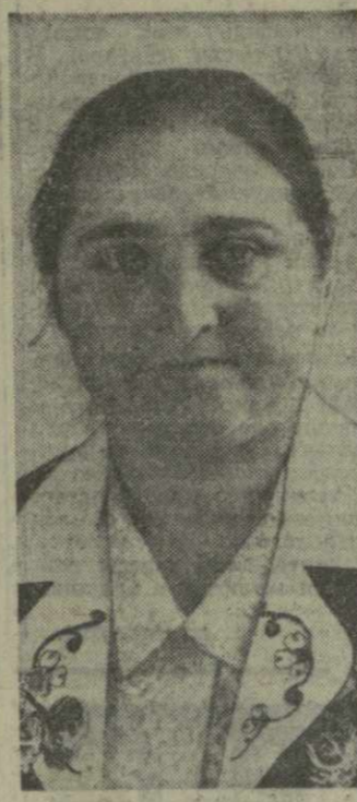
На снимке: С. Эмба, Фото И. Чохонелдзе. (Фотохроника Грузинформ)

На снимке: Н. Арахамия. Фото И. Чохонелдзе. (Фотохроника Грузинформ)