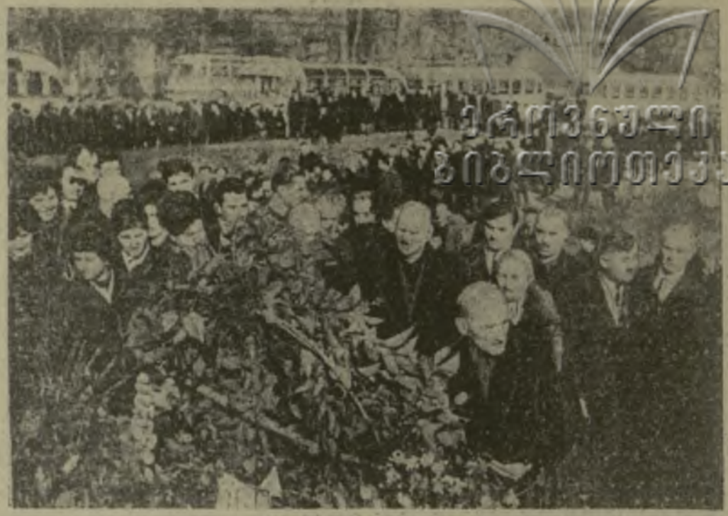
В минувшее воскресенье победно радушно встречали гости Кутаиси, прибывшие с театрано-туристическим поездом «Руставели». На снимке: гости из Кутаиси возлагают венки к памятнику В. И. Ленину.

женному труду которых план первого года пятилетки промышленности предпринята Кутаиси выполнили на 103,5 процента, выпустили на 5.390 тысяч рублей сверхплановой продукции. Это они в честь юбилея Великого Октября обязались ныне выполнить годовой план к 15 декабря, повысить производительность труда на 1,5 процента, за счет снижения себестоимости продукции получить дополнительно 800 тысяч рублей. Новых вам успехов, друзья, в юбилейном году!