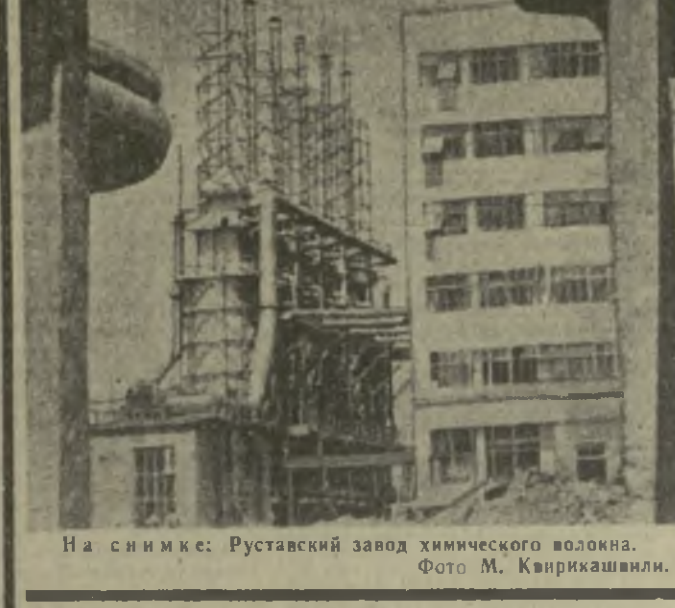
На снимке: Руставский завод химического волокна.