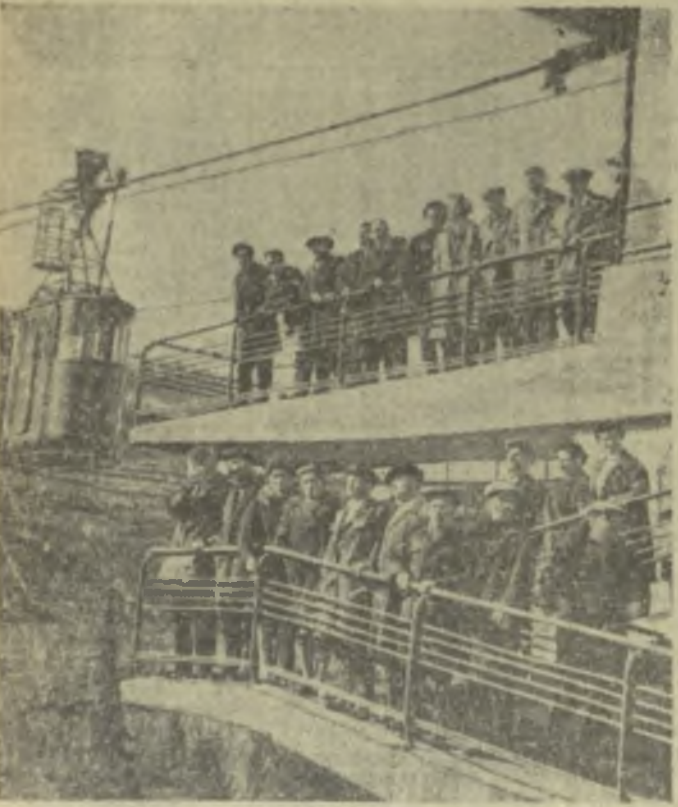
Много интересного повидали гулырпшцы в столице Грузии. На фото: гости из Гулырпшского района в парке Ваке.