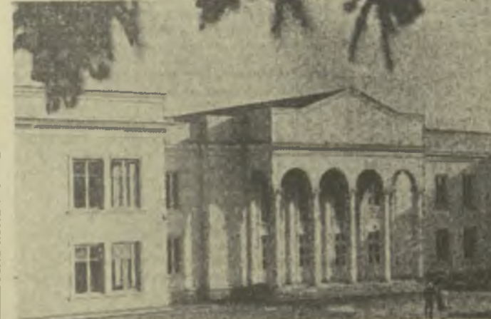
Замечательный подарок получили в юбилейном году члены сельскохозяйственной артели «Сакартвелло» села Рухи Зугдидского района. Здесь закончилось строительство колхозного Дворца культуры. В новом двухэтажном здании также разместятся правление колхоза, библиотека, читальный зал, радиоузел. На снимке: новое здание Дворца культуры колхоза «Сакартвелло».

150-200 миллиграммов в сутки для взрослых и в несколько меньших дозах для детей. Лекарство действует быстро — объясняется высоким содержанием так называемого «сртинина» — вещества, содержащего витамин «Р», который повышает прочность стенок сосудов и способствует их удержанию в организме витамина «С». Как оказалось, особенно много рутинина содержится не в сокке ягоды, а в ее твердых частях. Препарат применяется только под наблюдением врача, так как он совершенно противопоказан при повышенной свертываемости крови. Сейчас по заказу медицинских учреждений и аптек сибирское лекарство рассылается по стране. Готовятся также просьбы в Францию, где препарат будет изучать французские медики.