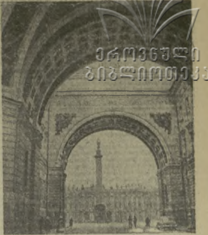
На снимках: слева — легендарный крейсер «Аврора», справа — Зимний дворец.

Л ЕНИНГРАД всегда полон обаяния. В эти дни особенно. Город на Неве — колыбель Октября — готовится к юбилейной революции, начало которой возвестил залп «Авроры», стоящей здесь у гранитного парапета набережной.