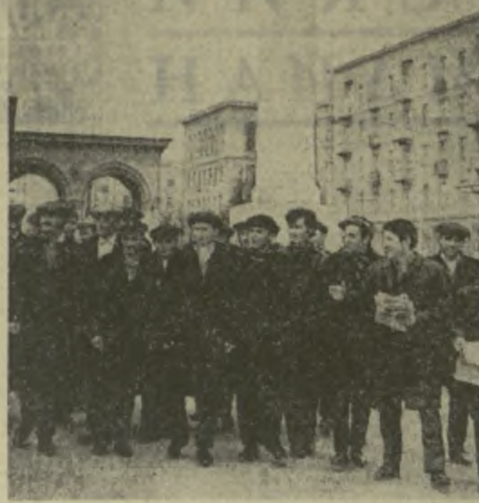
На снимке: гости из города Цхинвали на проспекте Н. Чавчавадзе.

Все предприятия Цхинвали закончили год с хорошими показателями. Неплохо взят старт юбилейного года. Далеко за пределами нашей страны известна продукция завода «Вибромашина». Изделия с его маркой знают в Болгарии, Венгрии, Румынии, Италии и в других странах. Цхинвалцы посетили Авлабарскую подпольную типографию, районы новостроек, побывали в театре имени Руставели на спектакле «Старые зурначи». А вчера поездом «Руставели» в Тбилиси прибыла еще одна группа трудящихся Юго-Осетии — посланцы Джавы. И они поведали тбилисцам о том, что произошло в их районе. На горном курорте Юго-Осетии расширяются помещения санаториев и домов отдыха, встает новые корпуса, благоустраиваются улицы, дороги. Все труженники района успешно несут предъюбилейную вахту.