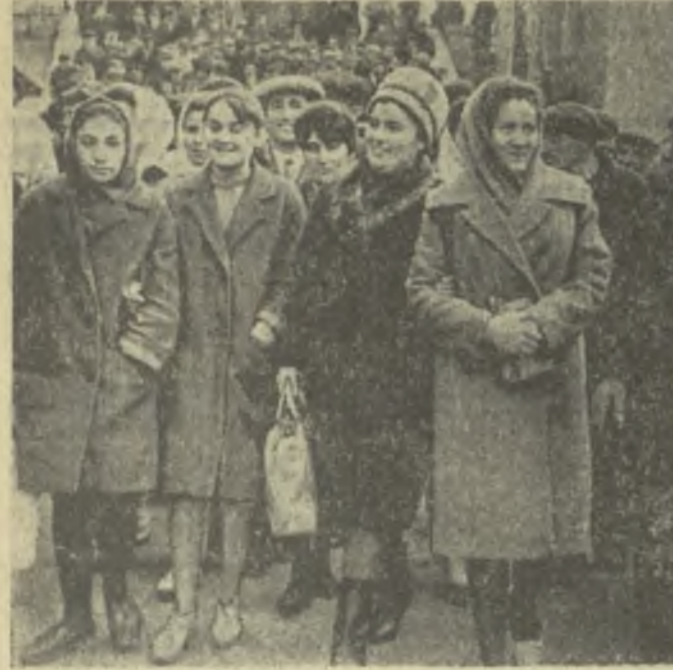
На снимке: труженники из Джавского района на перроне Тбилисского вокзала.