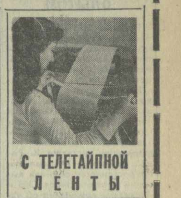
С ТЕЛЕТАЙПНОЙ ЛЕНТЫ