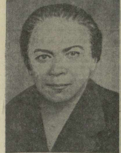
К 100-летию со дня рождения М. И. Ульяновой

Видный деятель Коммунистической партии, сестра, друг и помощник В. И. Ленина, Мария Ильинична Ульянова была активной участницей революционного движения в России. Вся ее жизнь до революции — это каждодневный риск на опасной работе большевистки-подпольщицы. С марта 1917 года до весны 1929 года М. И. Ульянова — член редколлегии и ответственный секретарь «Правды». Первые годы она трудилась в газете под непосредственным руководством Владимира Ильича. Громадный опыт работы с массами, умение прислушиваться к их голосу сделали ее активным организатором рабочего движения. Она была редактором журнала «Рабоче-крестьянский корреспондент». По образному выражению Михаила Кольцова, Н. К. Крупская учила Россию, безграмотную страну рабочих и крестьян, читать. Мария Ильинична учила рабочий класс писать. М. И. Ульянова была делегатом ряда съездов партии, членом ЦКК ВКП(б), членом Президиума ЦКК, членом коллегии Наркомата рабоче-крестьянской инспекции СССР, членом ЦИК СССР, возглавляла Объединенное бюро жалоб наркоматов РКИ СССР и РСФСР. Пристальной честность, верность идеалам марксизма-ленинизма, чуткость к людям снискали ей любовь партии и народа. За выдающуюся, самоотверженную работу в области коммунистического просвещения М. И. Ульянова была награждена орденом Ленина.