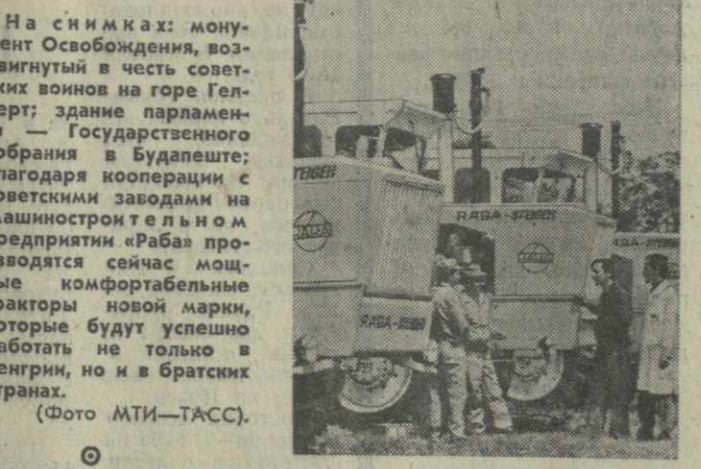
На снимках: монумент Освобождения, воздвигнутый в честь советских воинов на горе Геллерт; здание парламента — Государственного собрания в Будапеште; благодаря кооперации с советскими заводами на машиностроительном предприятии «Аба» производятся сейчас мощные комфортные тракторы новой марки, которые будут успешно работать не только в Венгрии, но и в братских странах.