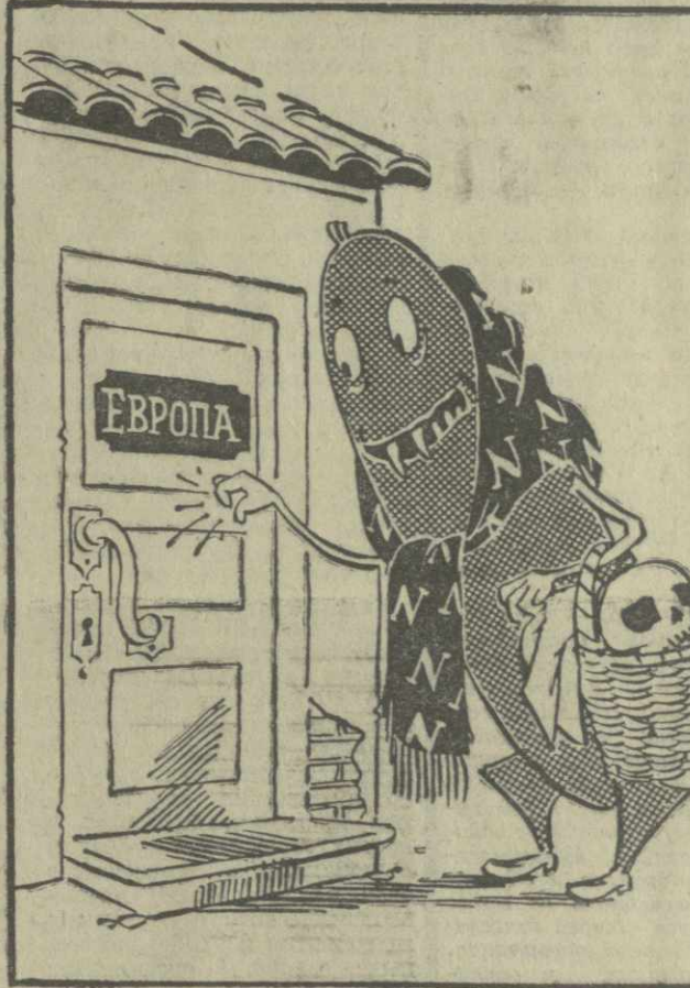
НЕЙТРОННАЯ СМЕРТЬ СТУЧИТСЯ В ДВЕРЬ. Рис. А. Канделики.

От имени СДП Г. Петерсен внес проект резолюции с призывом к датскому правительству «вступить против произ-