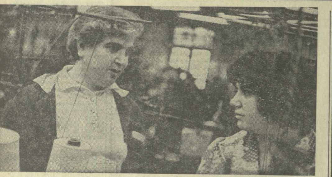
УНИВЕРСИТЕТ ТРАДИЦИЙ И БЫТА Прислушавшись к работе первый в Тбилиси народный университет традиций и быта. Он призван разъяснять трудящимся вред, наносимый отжившими обычаями, широко популяризировать новые, советские, прогрессивные.

Университет этот создан на швейной фабрике «Амирани». Заниматься в нем изъявили желание около ста тружениц предприятия.