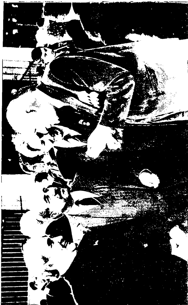
6. ლუბაძე, ჯ. ქუჩაველი, მ. ლუღინი, ირ. აბაშიძე.