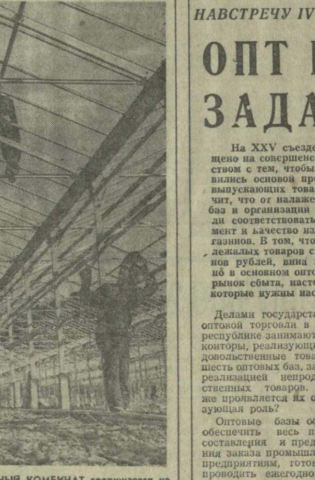
▲ ОХУРЕЙСКИЙ ТЕПЛИЧНЫЙ КОМБИНАТ сооружается на базе термальных вод. На площади в шесть гектаров уже закончена сборка теплиц из металлических конструкций, ведутся монтажные работы по отоплению. Строительство будет завершено в конце года. На комбинате предполагается ежегодно выращивать более 11.300 центнеров овощей. Строительство ведет ПМК-36 треста «Грузтеплицестрой» Министерства сельского строительства Грузинской ССР.