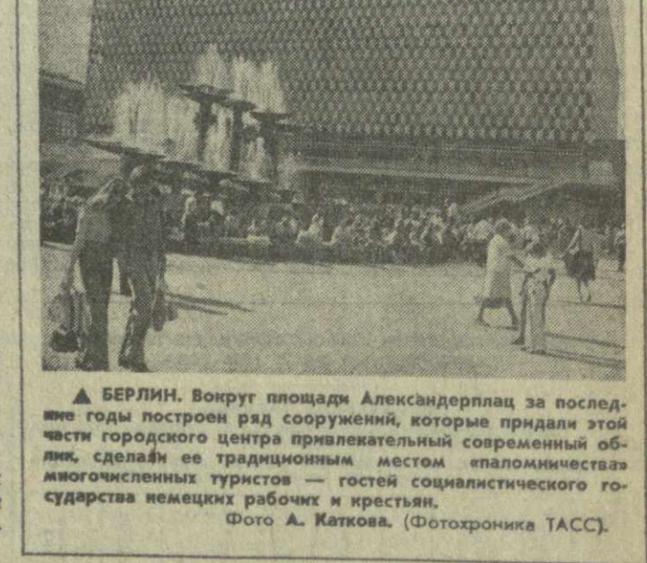
▲ БЕРЛИН. Вокруг площади Александерплац за последние годы построен ряд сооружений, которые придают этой части городского центра привлекательный современный облик, сделали ее традиционным местом «памяти» многочисленных туристов — гостей социалистического государства немецких рабочих и крестьян.

По материалам журнала «ГДР» и агентства печати «Панорама ГДР».