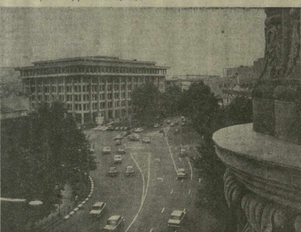
ТБИЛИСИ СЕГОДНЯ. Проспект Руставели.