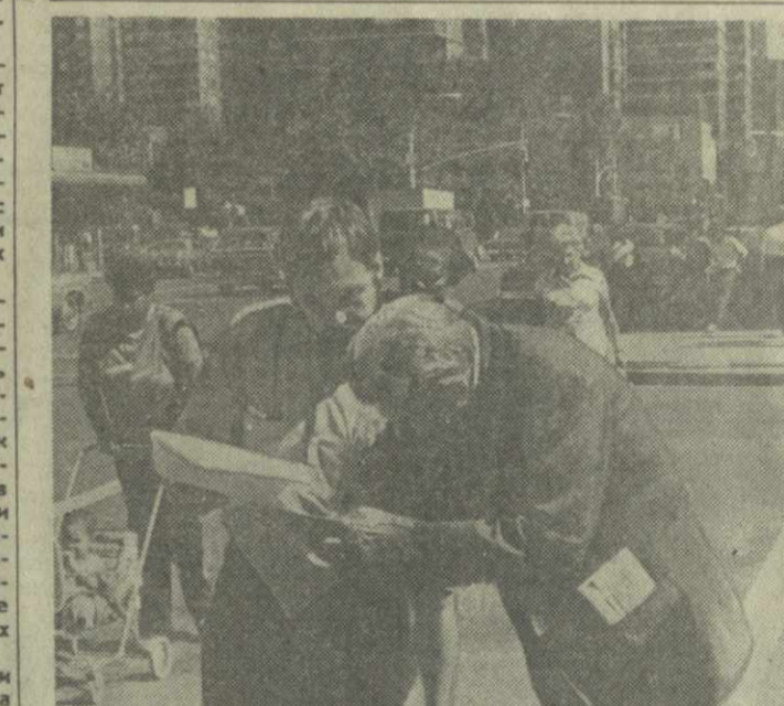
▲ КОММУНИСТИЧЕСКАЯ ПАРТИЯ Соединенных Штатов Америки продолжает свою предвыборную кампанию, добиваясь все новых успехов. На снимке: сбор подписей за выдвижение кандидата Компартии США Г. Холла и Дж. Тайнера на предстоящих президентских выборах.