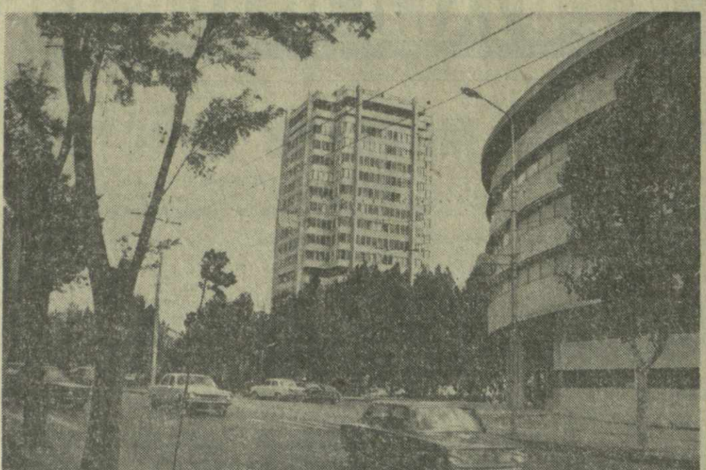
На снимке: улица Вахтанга Горгасани.