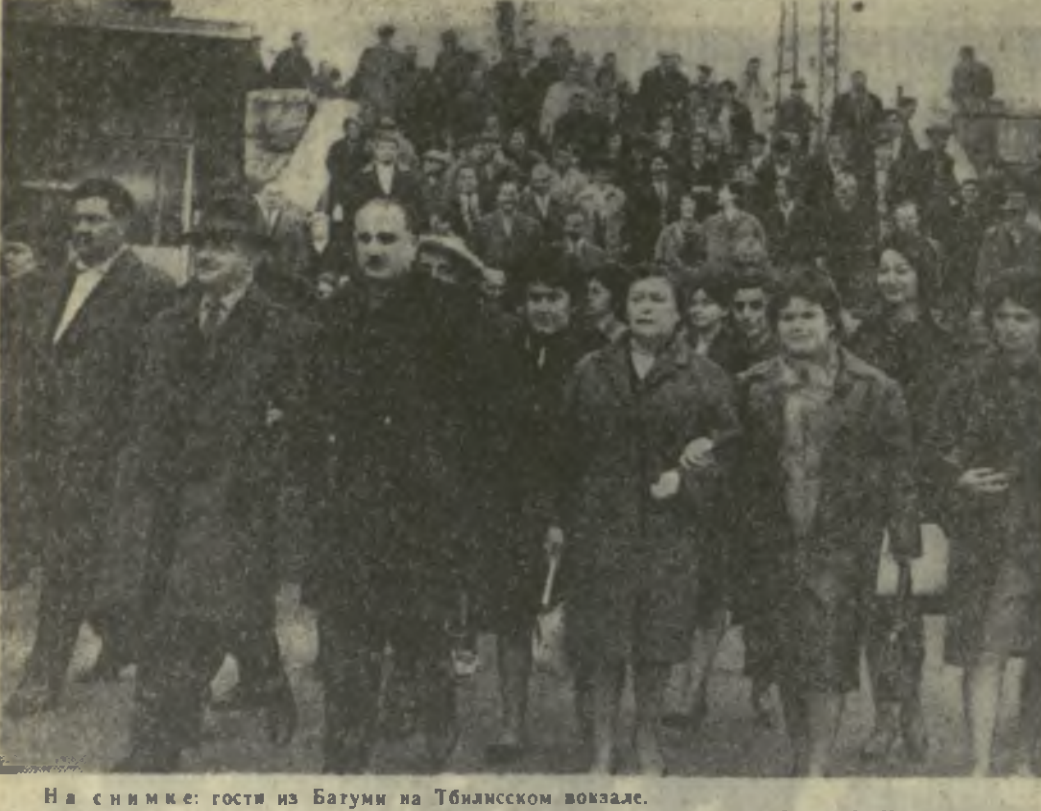
На снимке: гости из Батуми на Тбилиском вокзале.