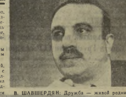
В. ШАВШЕРДЯН: Дружба — живой родник, из которого мы черпаем силы.