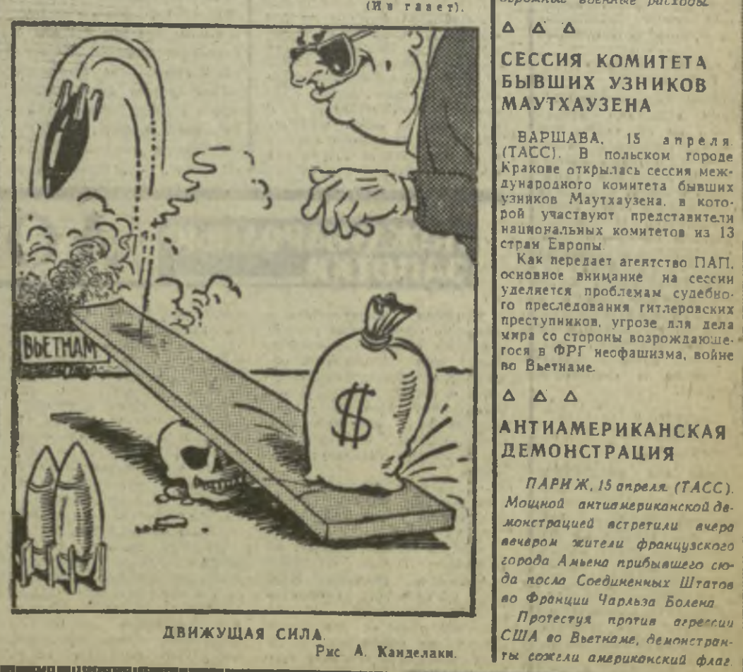
ДВИЖУЩАЯ СИЛА. Рис. А. Канделак.

В Социалистических Штатах выдвинули крупные дополнительные исследования на дальнейшее расширение американской агрессии в Юго-Восточной Азии.