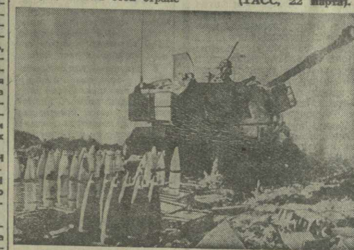
На снимках: сверху — из американских самолетов артиллерийских установок воинов Израиля ведет огонь по позициям Палестинского движения сопротивления и национально-патристических сил; внизу — палестинские беженцы спасаются от бомбардировки в городе Дамур.

Правительство Ирана решило также направить немедленную медицинскую помощь отрядам ПДС и ливанских национальных сил, борющихся с израильской агрессией. 50 иракских врачей выезжают в Ливан.