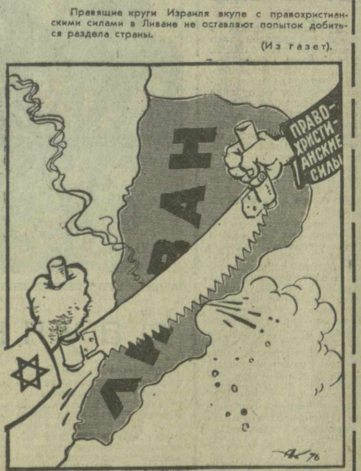
Попытки с негодными средствами. Рис. А. Кавделак.

▲ КАИР. Президент АРЕ Садат объявил на первой Сессии Народного собрания о преобразовании трех политических организаций, созданных ранее в рамках Арабского социалистического союза — левой, центристской и правой, — в три политические партии, которые, как он заявил, будут осуществлять свою деятельность независимо от организации АСС.