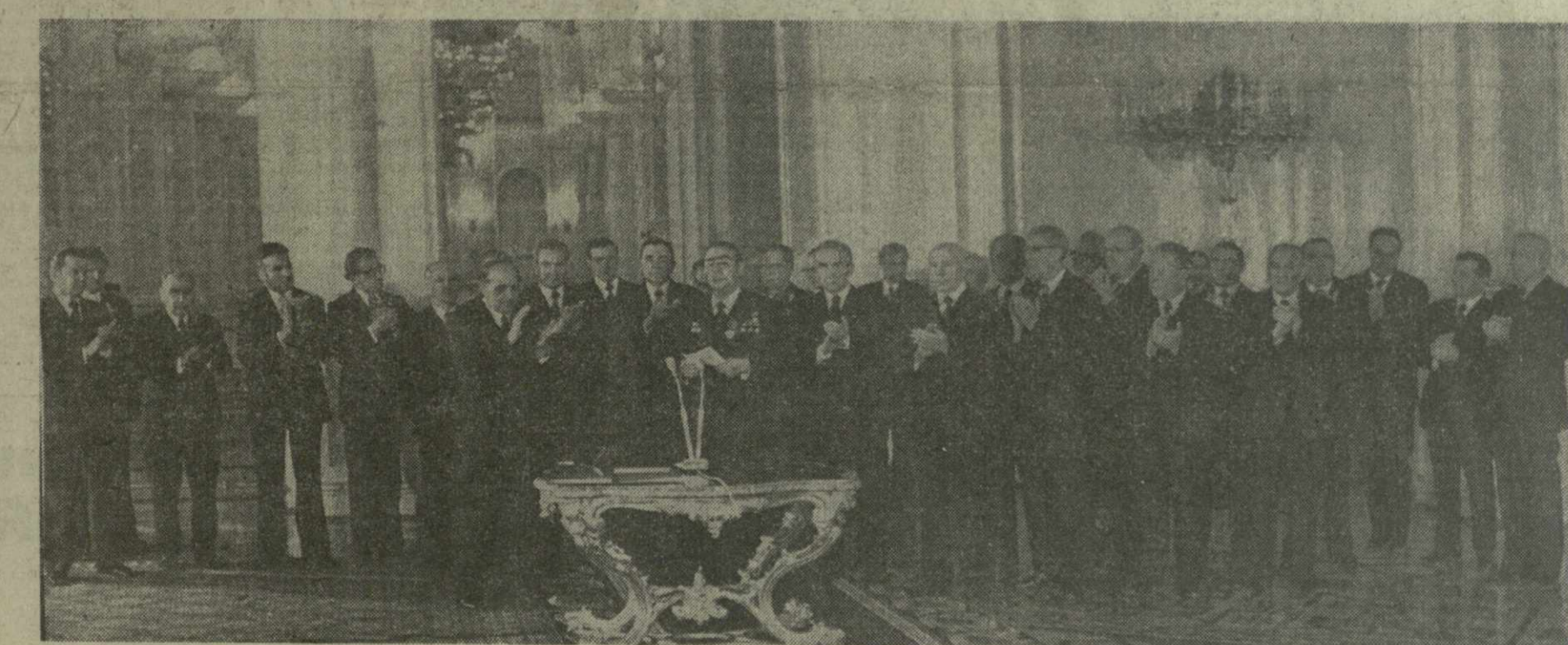
На снимке: во время вручения наград.